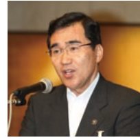
第3分科会委員長の森鹿見島市長