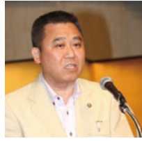
第1分科会委員長の森富山市市長