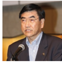
地方分権改革の推進に関する決議の提案理由を説明する山岸勝山市市長