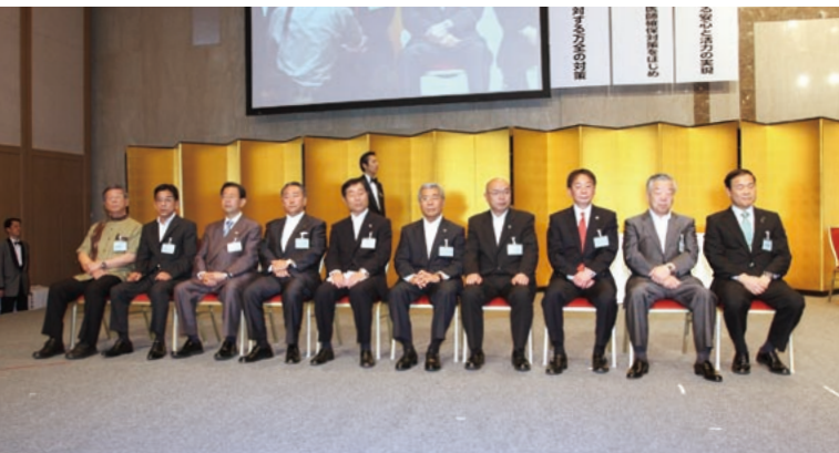
満場一致で選任された新正副会長。右から、新会長の森長岡市長、新副会長の大場綱走市長、穂積秋田市長、梶輪島市長、黒須八王子市長、木田鳥羽市長、倉田池田市長、竹内鳥取市長、原徳島市長、翁長那覇市長