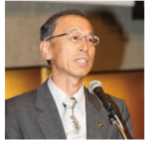
新市紹介であいさつする隈元伊佐市長