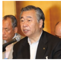
総会運営委員長として会議の進行に当たった久保田宇治市長