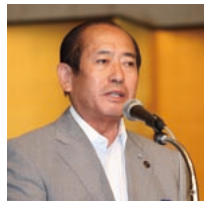
前役員を代表してあいさつをする高谷岡山市市長