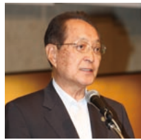
正副会長の選考経過および結果の報告を行う新宮室蘭市長