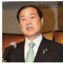
新会長に選任されあいさつする森長岡市長