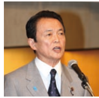
内閣総理大臣祝辞（麻生内閣総理大臣）