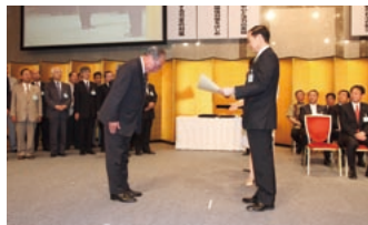
特別功労市長の表彰を受ける桑原鹿島市長