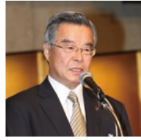
新市紹介であいさつする谷口日南市長