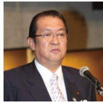
総務大臣祝辞（鳩山総務大臣）