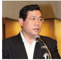
都市税財源の充実強化に関する決議の提案理由を説明する上田大和郡山市市長