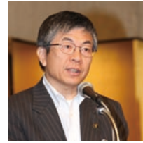
新型インフルエンザ対策に関する緊急決議の提案理由を説明する岡崎高知市長