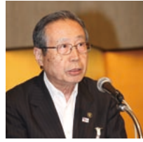
第2分科会委員長の土野高山市長