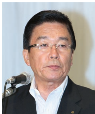
正副会長の選考経過および結果の報告を行う釘宮・大分市長