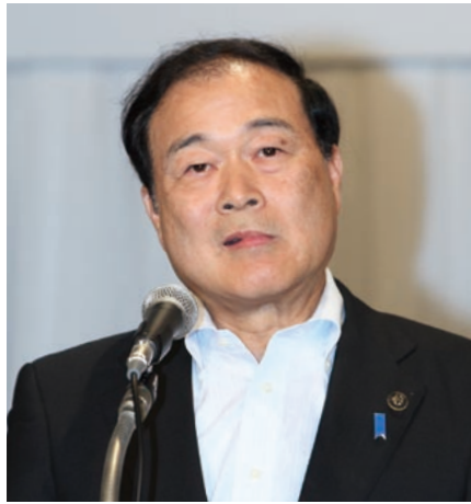
開会のあいさつをする森会長