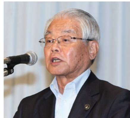
「真の分権型社会の実現を求める決議」の提案理由を説明する五藤・三原市長