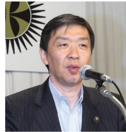
渡辺・岩見沢市長