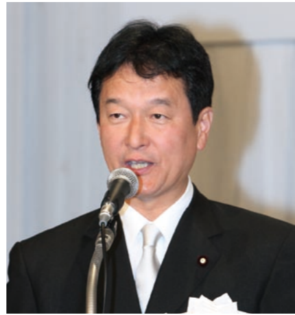
総務副大臣祝辞 大島総務副大臣