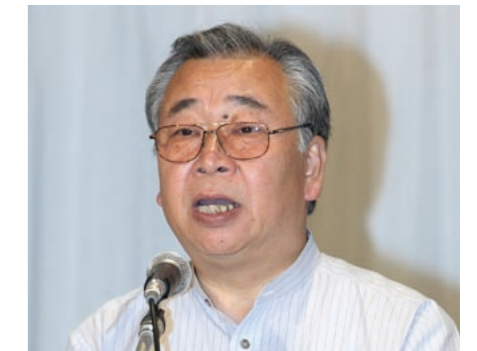
第3分科会委員長の久保田・宇治市長