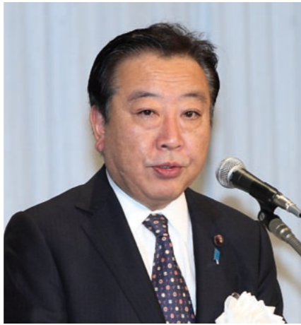
内閣総理大臣祝辞 野田内閣総理大臣