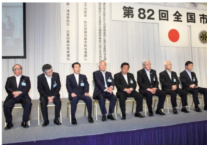
選出された新副会長