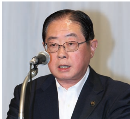
「東日本大震災からの復旧・復興に関する決議」「東京電力福島第一原子力発電所の事故への対応と安全対策等に関する決議」の提案理由を説明する土田・東根市長