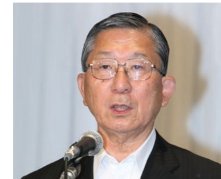
第2分科会委員長の八並・行橋市長