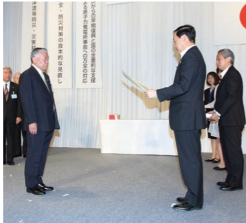
永年勤続功労市長を代表して表彰を受ける多田・江戸川区長