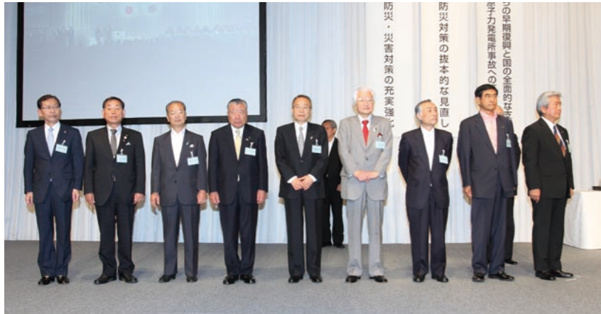
永年勤続功労市長の表彰を受けた方々