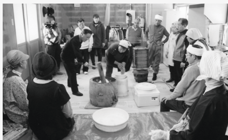
仲間との「餅つき大会」

かほく市が誕生して、今年で10年目の節目の年となりました。合併後これまで、定住促進、子育て支援、安全安心、生活環境向上、インフラ整備など住みよいまちづくりを重点的に推進してきました。その結果、今年の大手経済誌の「住みよきランキング」では、総合13位と年々ランクアップできています。たかが数字ですが、さほど数字です。市民の皆さまに、住んで良かったと心から実感してもらえよう、さらなる住みよいまちづくりに向け走り続けたいと思っています。