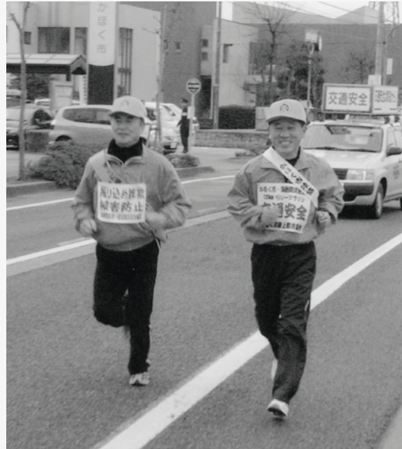
「交通安全リレーマラソン」の第1走者で健闘する筆者(右)

父が亡くなった後、一期だけでもやってみると言われた町議に立候補し初当選しました。しかし一期目に当時の町政の問題に直面し、任期途中で町長選に立候補し、現職との一騎打ちの末、当選を果たすことができませんでした。祖父、父、私と三代にわたって町政を預かることになりましたが、奇しくも私の任期中に、長い町の歴史を閉じることにもなりました。