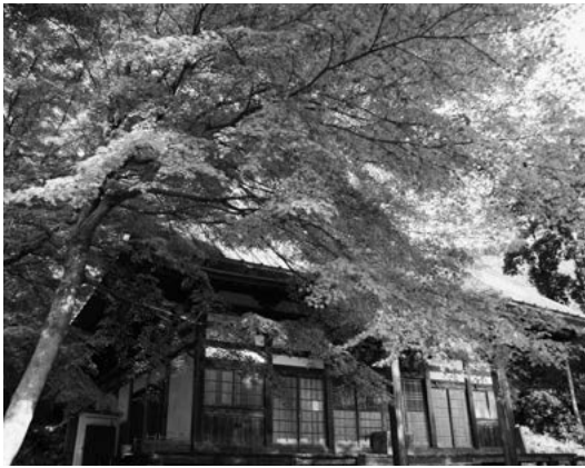
奈良時代に建立された長谷寺

平成26年2月の大雪害では、ビニールハウスの9割が倒壊しましたが、国、県の支援もあり、被災農家の9割が再建に立ち上がっており、本年度中にはすべて再建できるような力で取り組んでいます。生産の大宗を占める露地はまったく問題なく、本年も質量ともに自慢の笛吹の果実を消費者に届けるべく農家の皆さんは頑張っています。国内消費の飽和感に対応し、手取り単価の向上を図るため、今後は高級品需要が見込まれ