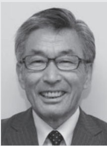
笛吹市長 倉嶋清次