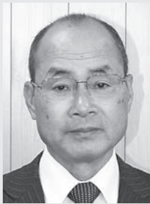
香美市長 法光院晶一

〔市町村合併〕平成18年3月1日に、物部川流域の旧3町村（土佐山田町・香北町・物部村）が合併