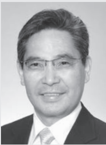
可児市長 富田成輝