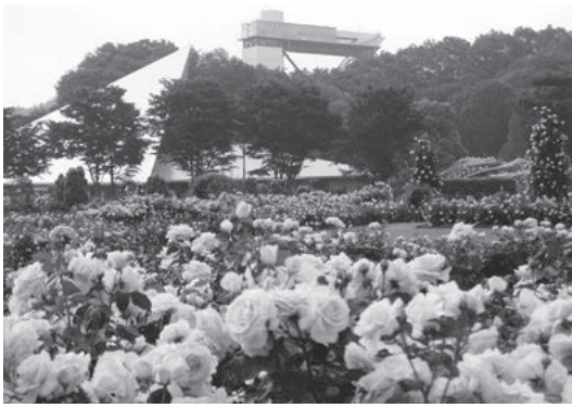
世界最大級のバラ園・花フェスタ記念公園

日までの37日間、世界最大級のバラ園が贈る美しく、ご当地グルメも楽しめる祭典です。交流人口の増加が市の活性化へ、ひいては定住人口の増加へとつながっていくものと考えています。