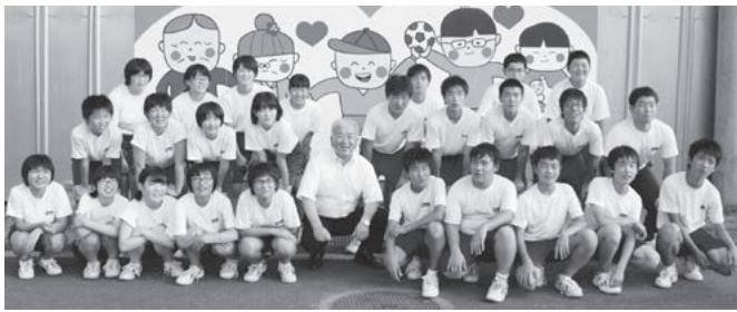
勝部市長と地元中学生とのILC看板製作

ILCの実験は、物質を構成する最小単位である素粒子、電子と陽電子を正確に衝突させる必要があるため、人工振動が少なく、活断層がない硬い岩盤が30kmから50kmにもわたり必要となります。