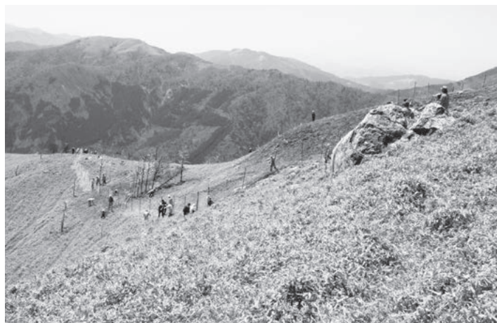
ニホンジカの食害対策として進める防護ネット設置の様子

このような状況を打開するため、本市では適正な森林管理の基盤となる林道、作業道をはじめとした路網整備、