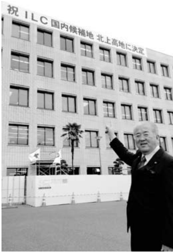
一関市役所庁舎に掲げるILC国内候補地決定横断幕