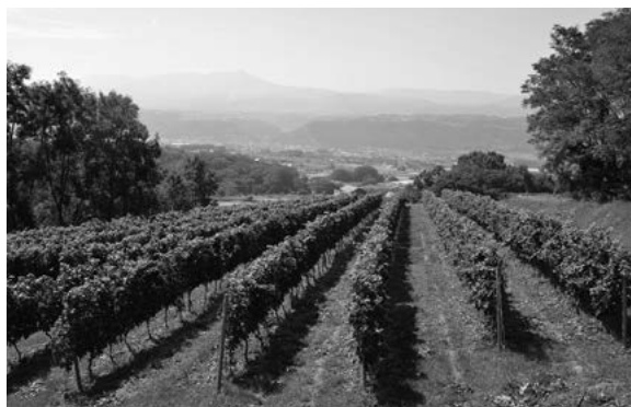
市内に広がるワイン用ぶどう畑

多くの方に本市を訪れていただくよう、先人たちが紡いできた歴史や風土を守り育てつつ、ワイン振興などの新たな分野にも挑戦し続けております。こうした取り組みが再び訪れたいと思える契機となり、市外から訪れる方だけでなく、そこで暮らす住民にとっても誇りに思える心が育ってきております。ワインをキーワードとし