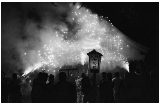
手製の花火から吹き出す火の粉で神社を清める「高岡流綱火」