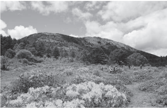
高山植物の宝庫として知られる「湯の丸高原」

上信越自動車道東部湯の丸ICから、車で25分ほど走ったところから、本市が誇る観光拠点の一つ「湯の丸高原」があります。夏はコマクサなどの高山植物の宝庫となり散策やトレッキング、冬はスキーやスノーボードなどウィンタースポーツを楽しみに、多くの方が訪れています。毎年6月下旬には、70万株ともいわれる国の天然記念物にも指定されているレンゲツツジ群落