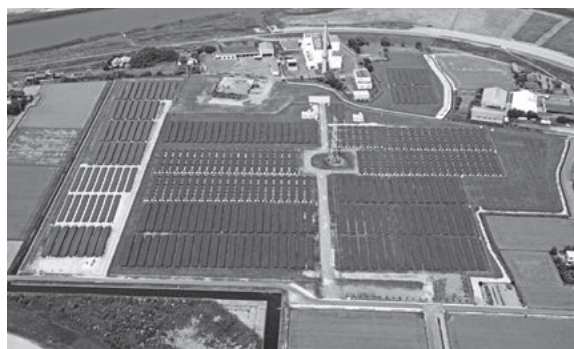
市内にあるメガソーラーの1つ「みやま高柳発電所」

一方で、楽しみながら安心してスマートライフを送れるよう、さまざまなサービスをを行っています。具体的には、モニター世帯へタブレットを配布し、次のようなサービスを行っています。