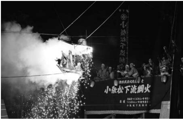
やぐらの上から、綱を操り空中で人形芝居を演じる「小張松下流綱火」

大樹から舞い降りた赤と黒のクモが巣をつくるのを見て暗示を受けた村人が編み出したと伝えられています。