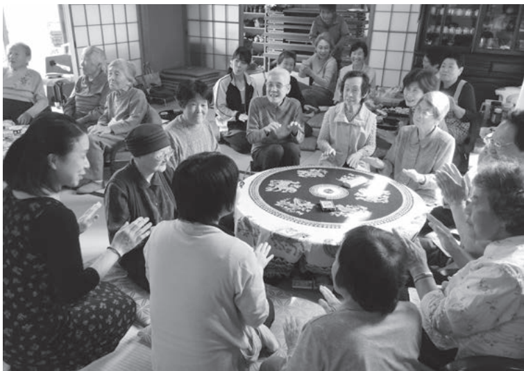
地域お茶の間創造事業によるお茶の間（居場所）の様子

が市町村事業である地域支援事業へ移行され、新しい総合事業として始まっています。本市では、この「新しい総合事業」を平成28年度から実施する予定です。