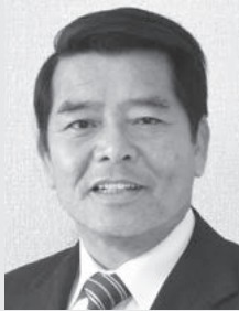
米原市長 平尾道雄

〔市町村合併〕 平成17年2月14日、山東町、伊吹町、米原町が合併して米原市となる。平成17年10月1日、米原市と