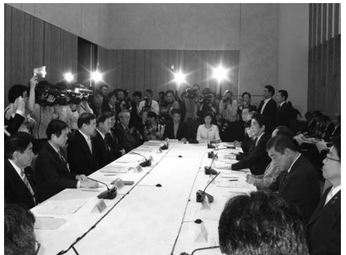
森会長（左手前から2番目）