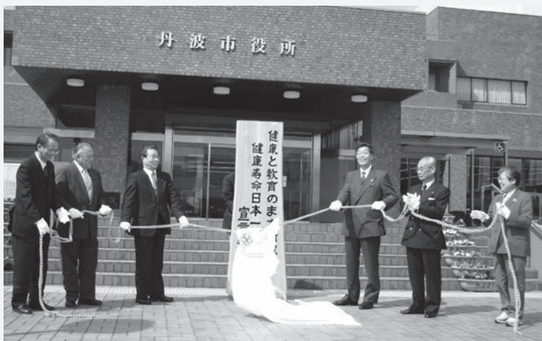
「健康寿命日本一宣言」の除幕式を行う筆者(左から3人目)(平成18年4月3日)

平成16年12月6日初登庁と同時に連続する諸行事に追われる中、ちょうど選挙前に台風23号の襲来で大雨洪水に見舞われ3名の尊い命をなくし、山林・田畑に大被害を受けました。災害復旧のため、600m級の山々を国や県の農林関係者を案内して駆け巡りましたら顔色が悪くなり、息苦しさを強く感じ、出会う市民の皆さんから