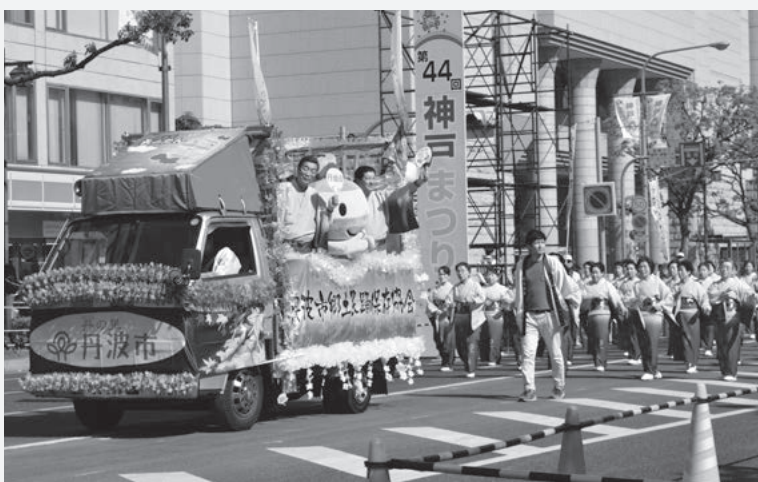
神戸まつりで丹波市をPRする筆者（平成26年5月18日）

もう年齢も後期高齢者になり喜寿を迎える年となりました。自家製野菜（キャベツ、玉ねぎのスライス等）を毎日食し、肉類を最小限に摂取するといった食生活に気を配っています。もう一点はストレスを溜めないため、適度な軽運動（歩く）や