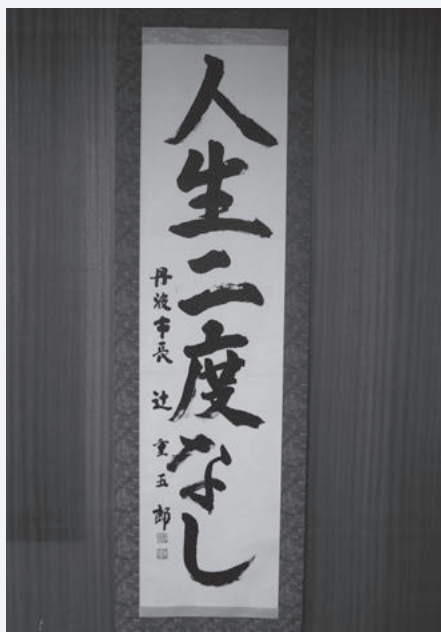
座右の銘 人生二度なし

長として立候補する際にも、随分と迷いがあり「何をするために自分は市長になるのか」の自問自答を繰り返す時「人生二度なし」の心理の中に答えを見出したように思っています。旧6町の50年に渡る歴史、風俗、習慣、旧町政の特性等々、大きな違いがあり、市役所職員も865名をかかえての出発で1061億円の負債もあり、500km 2 の面積、旧6町の役場を中心とした諸施設がすべて6通りといった新市、丹波市の厳しい誕生でした。