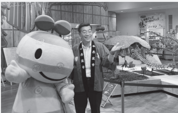
丹波市のゆるキャラ「丹波竜のちーたん」と共に

全力投球で頑張れることは一度しかない人生を有意義なものにする職だと考えています。また、社会のために役立ちたいと多くの人たちが思っておられる中、市長職こそ最高の市民の先頭に立つことができる立場と考えております。だからこそ社会に役立つ自覚をもって頑張っていく所存です。