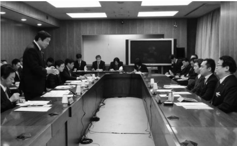
牧野・飯田市長（右手前）

詳細につきましては、全国市長会ホームページ ( http://www.mayors.or.jp/ ) をご参照ください。