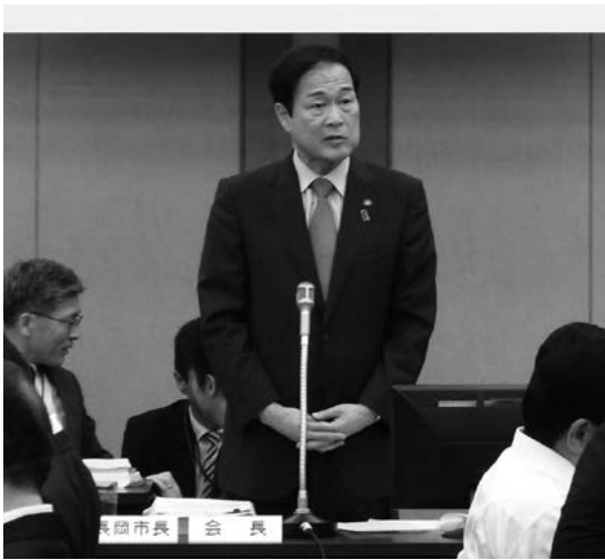
あいさつをする森会長