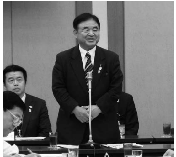
遠藤・東京オリンピック・パラリンピック競技大会担当大臣

7月の理事・評議員合同会議以降の会務等の報告を了承した後、前日開催の行政、財政、社会文教、経済の各委員会における審議経過