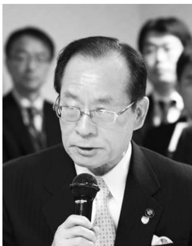
朝長・佐世保市長