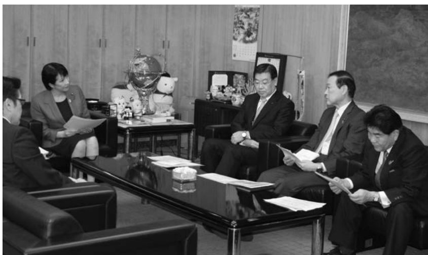
森会長（右から2番目）

詳細につきましては、全国市長会ホームページ ( http://www.mayors.or.jp/ ) をご参照ください。