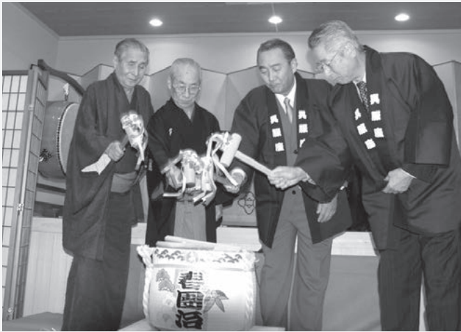
「上方落語資料展示館」オープニングの鏡開き（筆者右から2人目）（平成19年4月）

22歳で池田市役所に奉職、26歳で池田市議会議員に当選、5期20年を経て、46歳で池田市長に就任、少々紆余曲折があったものの4年間の空白期を経て、現在池田市長6期目となっています。昨年の選挙でのスローガンは「愛する池田の明日のために」で