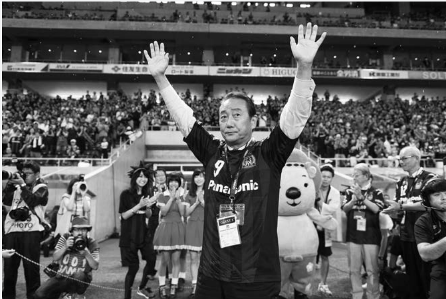
ガンバ大阪主催「池田市民 応援デー」3万数千人の観客が見守る中、ホーム球場でキックイン（平成28年6月）

えてお応えしたら、何とその翌年（平成11年）には、池田駅の南側に「インスタントラーメン発明記念館」を安藤スポーツ・食文化振興財団の手で建設・開館して下さったのです。「倉田市長に建てさせられた」安藤百福翁の口癖でしたが、そういう口元がいつもほころんでいたことを昨日のように思い出されます。そのイン