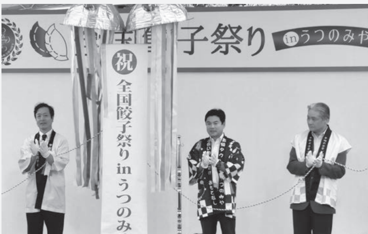
市制施行120周年の平成28年に開催された「2016全国餃子サミット&全国餃子祭りinうつのみや」

もう1つは、「雨好晴奇」です。この言葉は、私が22歳の時に亡くなった、人生の師であり、目標でもある父が残した言葉です。この言葉には、「人生には晴れた日より、雨のような辛い日のほうが多いのだ