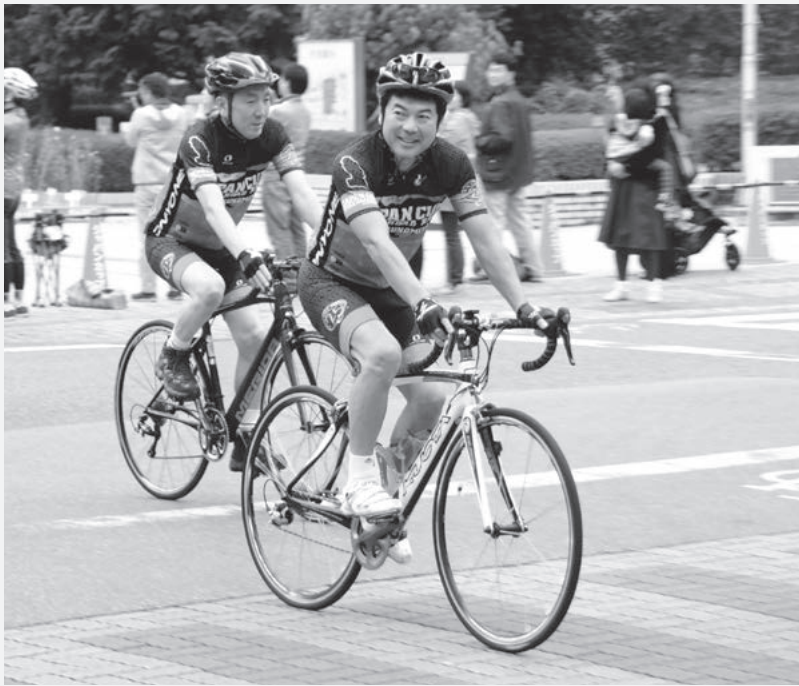
ジャパンカップサイクルロードレースのパレード走行に参加する筆者

後、読書量はさらに増加し、平成27年度において、1カ月の読書量が小学校で29・7冊、中学校で10・3冊と、全国平均の約2・5倍となっています。