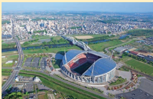
ラグビーやサッカーの国際大会が開催される「豊田スタジアム」

豊田市では、市が持つ魅力に改めて気づき、愛情を持って行動し、次の世代に引き継いでいくため「WE LOVE とよた」条例を定め、さまざまな取り組みを進めています。200年ほど前から続く豊田市のお茶栽培も本市の魅力のひとつです。今回ご紹介する「手摘み抹茶の焼き菓子」は、土づくりから石臼挽きまでを一貫生産しているこだわりの茶園が作り上げた逸品で、贅沢に使用された手摘み抹茶の豊かな香りと深い味わいが存分に楽しめます。