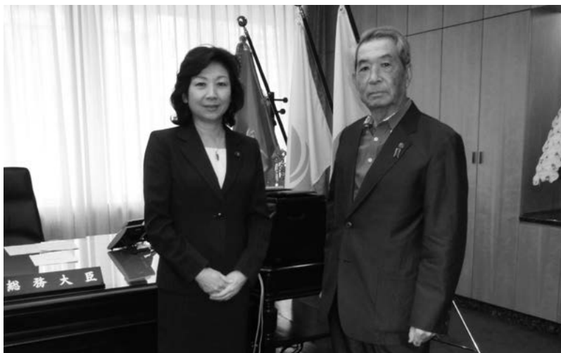
野田聖子・総務大臣（左）、松浦会長（右）

#4 松浦会長が総務大臣、文部科学大臣等にあいさつ 松浦会長は、8月9日、第3次安倍内閣第3次改造により新たに就任された野田聖子・総務大臣、林芳正・文部科学大臣、奥野信亮・総務副大臣、小倉将信・総務大臣政務官、小林史明・総務大臣政務官にそれぞれ面会の上、あいさつを行った。