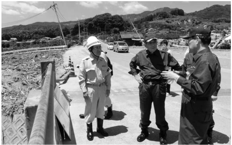
朝倉市内の被災現場視察