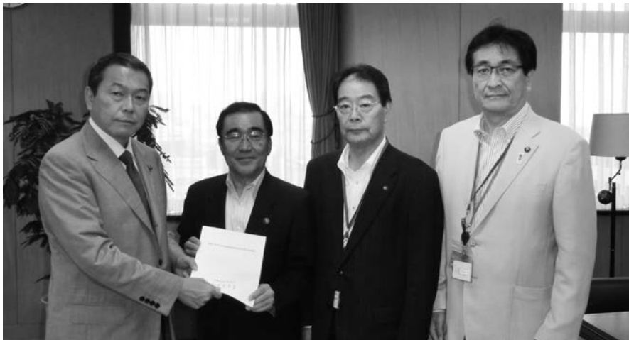
小此木・内閣府特命担当大臣（防災）に要請（左から小此木大臣、森・鹿児島市長、森田・朝倉市長、原田・日田市長）

#5 森・鹿児島市長（九州市長会会長）、森田・朝倉市長、原田・日田市長が「平成29年7月九州北部豪雨災害に関する要請」の実現方について要請 8月10日、九州市長会会長の森・鹿児島市長、森田・朝倉市長、原田・日田市長は、小