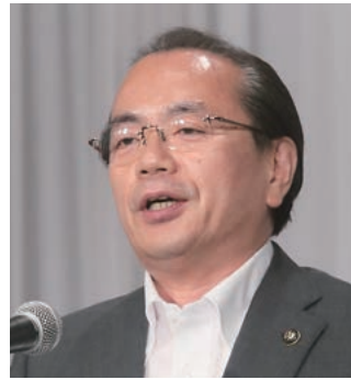
遠藤・徳島市長 「参議院選挙制度改革に関する決議」