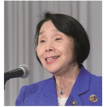
清原・三鷹市長 「子ども・子育てに関する決議」