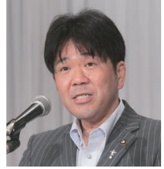
第4分科会委員長の大城・八幡浜市長