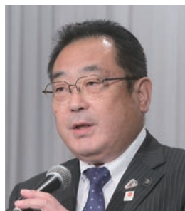
副会長：伊藤・大崎市長