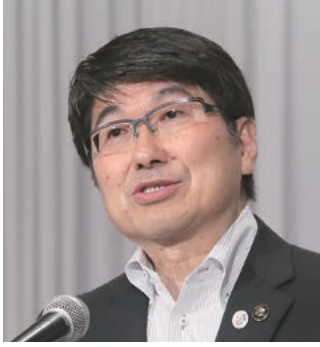
第1分科会委員長の田上・長崎市長