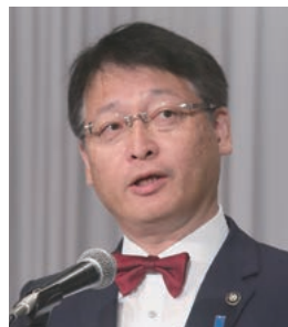
副会長：谷畑・湖南市長