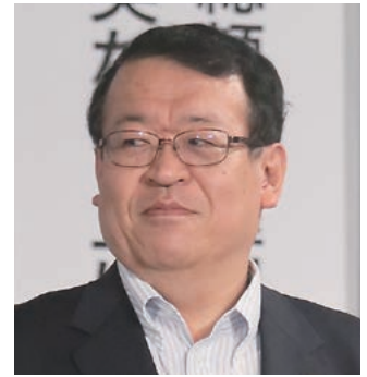
牧野・飯田市長 「ネクストステージに向けた都市自治体の税財政のあり方に関する特別提言」