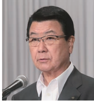
第2分科会委員長の山口・千歳市長