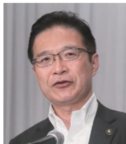
副会長：前葉・津市長