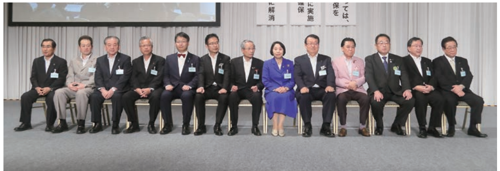
満場一致で選出された新正副会長