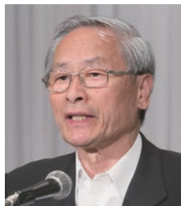
副会長：保坂・甲斐市長