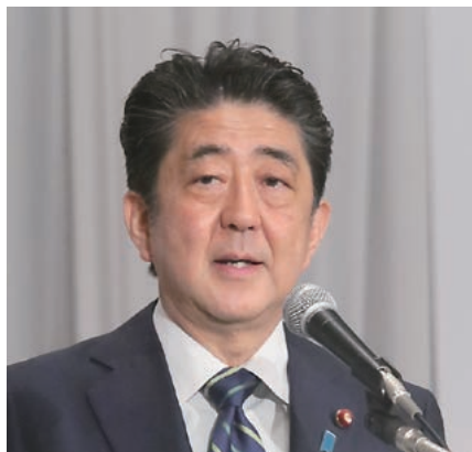
安倍・内閣総理大臣