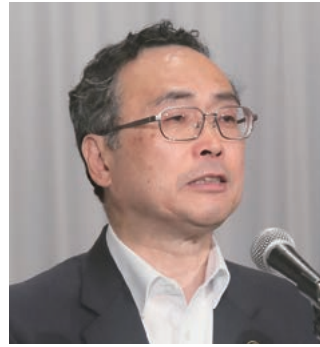
深澤・鳥取市長 「都市税財源の充実強化に関する決議」