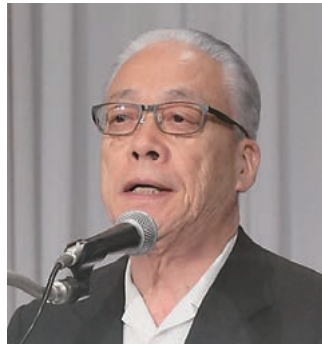
森山・摂津市長 「公立小中学校施設整備のための予算確保に関する決議」