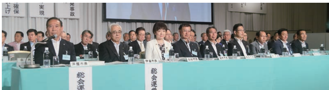
左から、山中・芦屋市長、菊谷・伊達市長、郡・仙台市長、小口・塩尻市長、亀山・桐生市長、前葉・津市長、石田・倉吉市長、大西・高松市長、森・鹿児島市長