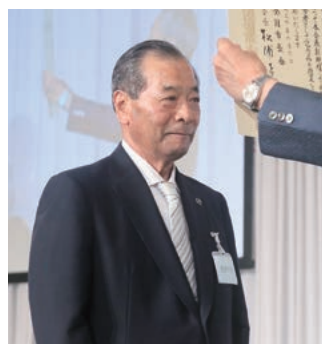
永年勤続功労市長を代表して表彰を受ける鈴木・君津市長