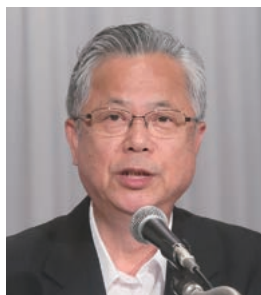
副会長：神出・海南市長