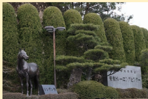
馬の街栗東のシンボル「シンザン像」

※面積は国土地理院「全国都道府県市区町村別面積調」に、人口は「住民基本台帳」による。