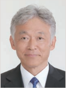
阪南市長 水野謙二