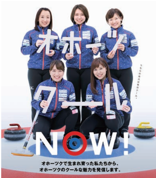
オホーツクで生まれ育った私たちが、 オホーツクのクールな魅力を発信します。