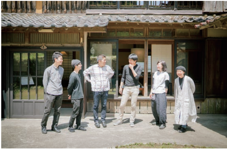
クリエイターを中心に新たな地域づくりが進む本市小浜町刈水地区