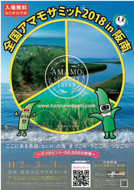
11月開催の「全国アマモサミット2018 in 阪南」