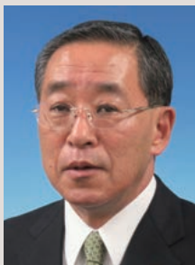
北見市長 辻 直孝

点として、「サテライトオフィス 北見」を整備するとともに、本市 の食と宿泊を核として、道東を周 遊する新たな顧客を掘り起こす着 地型観光の振興を進めるなど、将 来にわたり持続的発展が可能な、 活力あるまちづくりに引き続き取 り組んでまいります。