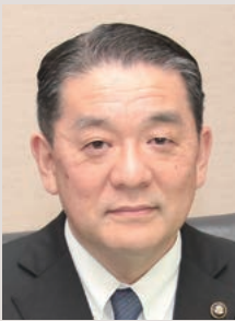
雲仙市長 金澤秀三郎