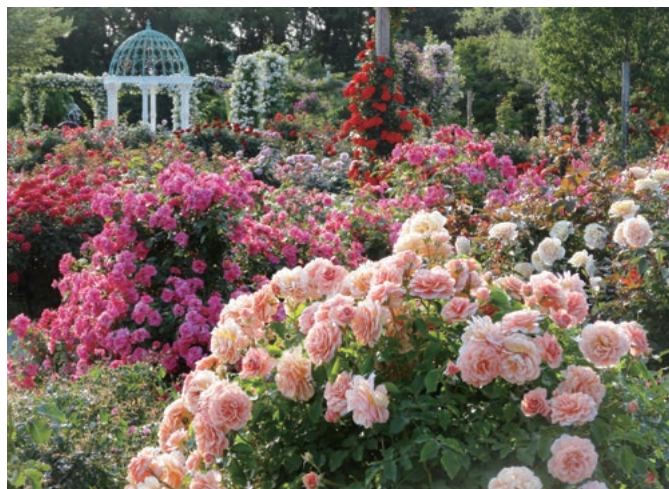
奥に見えるガゼボはブライダルマザー桂由美さんのプロデュース

これの梨園や品種ごとのおいしさを 楽しむことができます。 市の花は「バラ」で、市内には、 1600品種、1万株のバラを所 有し、品種改良で世界的に高い評 価を受けている「やちよ京成バラ 園」があります。ロマンチックな スポットを選定する「恋人の聖地」 に選定されており、春と秋には色 とりどりのバラが咲き誇り、多く の観光客が訪れます。