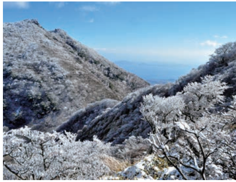
朝日に輝く、白銀と光の芸術「雲仙岳の霧氷」

雲仙市は、長崎県の南東部、島原半島の北西部に雲仙普賢岳を取り巻くように位置し、肥沃な大地や有明海と橘湾の2つの海を生かした農林水産業と、泉質の異なる雲仙温泉と小浜温泉、四季折々の美しい景観、温暖な気候、豊かな