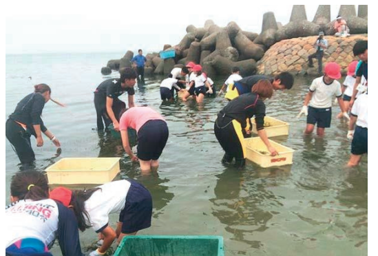
地元小学生によるアマモ学習活動

〔イベント〕山中溪桜祭り、はんなん産業フェア、全日本ビーチパレード、ジュニア男子選手権、潮干狩り、せんなん里海さくらフェス、秋祭り