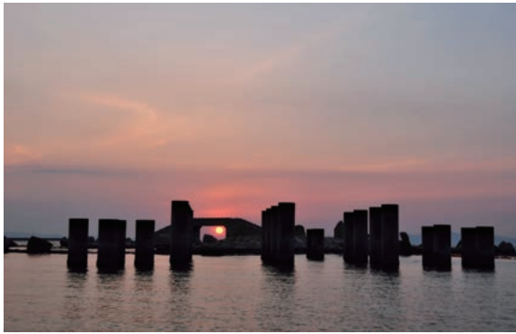
「日本の夕陽百選」に選ばれた「びちびちビーチ」夕景

関西国際空港は世界から人を受け入れ、世界へ飛び立つ玄関口として成長を続けています。阪南市は空港まで30分、大阪市中心まで40分、和歌山市まで20分の立地に