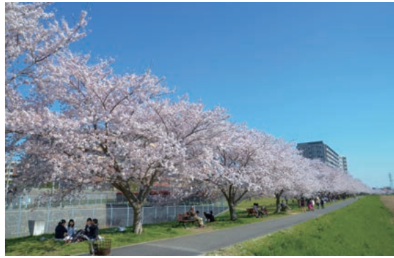
「新川千本桜の会」のボランティアが手入れをする桜並木

市の中央を流れる新川周辺は、市民の憩いの場となっています。水と緑の調和が美しい両岸にはお