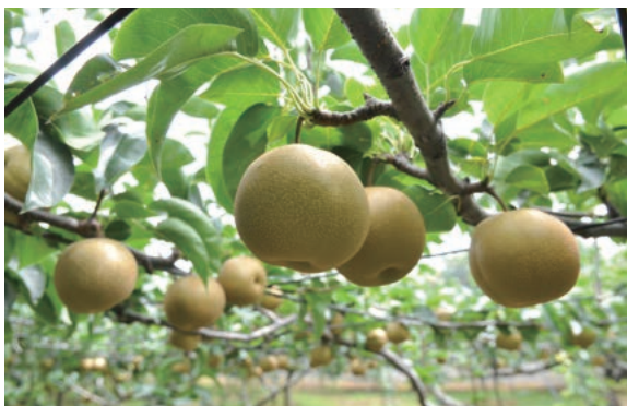
木で完熟したものを直売所で販売する八千代の梨は格別の瑞々しさ

市内ではさまざまな農産物が育てられています。1914年(大正3年)に栽培が始められ、100年を超える歴史があります。現在は62軒の農園があり、幸水、豊水、新高など20品種以上が栽培されています。8月中旬には、市内のあちこちで直売所が開かれ、それぞ