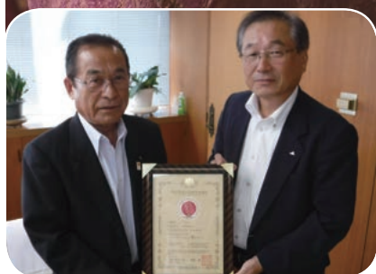
GI認証登録を島田俊光市長(左)に報告する 渡邊博康組合長