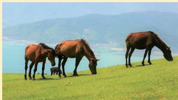
野生の御崎馬(みさきうま)が棲息する「都井(とい)岬」

※面積は国土地理院「全国都道府県市区 町村別面積調」に、人口は「住民基本台 帳」による。