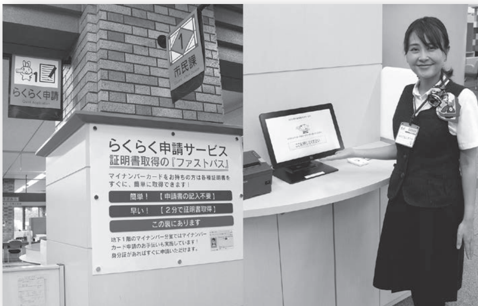
“おもてなしガイド”に案内を受けながら申請ができる市民課窓口の“らくらく窓口証明書交付サービス”

サービス」を開始している。予防接種の履歴確認機能や接種時期通知機能は利用者に喜ばれており、子育て日記機能等により、子どもの成長を楽しみながら使っていただけの工夫も凝らしている。