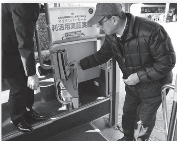
実証用マイナンバーカードを利用し、高齢者バス優待乗車を体験する市民（総務省実証事業）

バスでのマイナンバーカード活用の実用化には、バス運賃箱の機器にマイナンバーカードの使用を考慮した対応が必要となるなど、技術面での課題があることが分かった。一方で、実証請負事業者が作成したシステムは、バス優待乗車以外のさまざまな行政サービスで応用利用できるものであり、申請手続きの