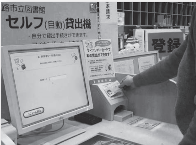
マイナンバーカードの電子証明書の失効確認に対応した図書自動貸出機 (姫路市立図書館)

高いサービスであることが分かる。マイナンバーカードが普及し利用者が増加することで、証明書交付事務の効率化も期待できる。