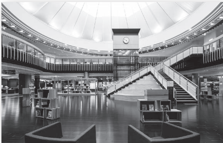
次世代型の新図書館