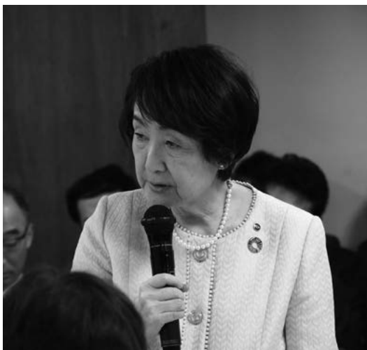
林・横浜市長（指定都市市長会長）