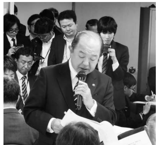
遠藤・座間市長（全国基地協議会副会長）