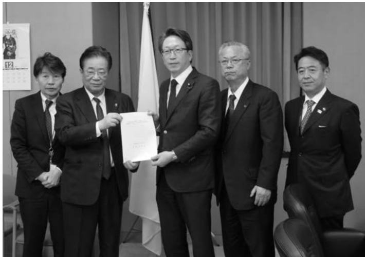
平・内閣府副大臣に要請