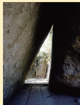
年間約36万人が訪れる 世界遺産 「斎場御嶽」

※面積は国土地理院「全国都道府県市区町村別面積調」に、人口は「住民基本台帳」による。