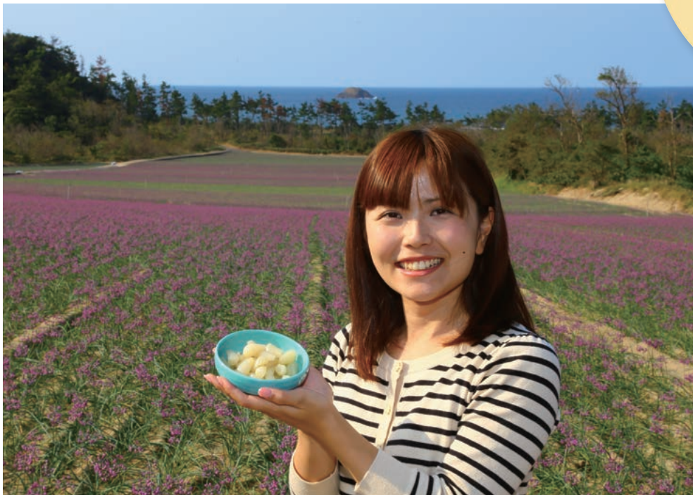
10月下旬ごろから美しい紫色の花をつける鳥取砂丘らっきょう