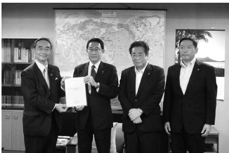
自由民主党の岸田・政務調査会長に要請

#4 「新しい時代の学びの環境整備に向けた緊急提言」及び 九州豪雨対策、国土強靱化等に係る 「緊急要望事項」の実現について、 立谷会長が自由民主党の 岸田・政務調査会長等に要請