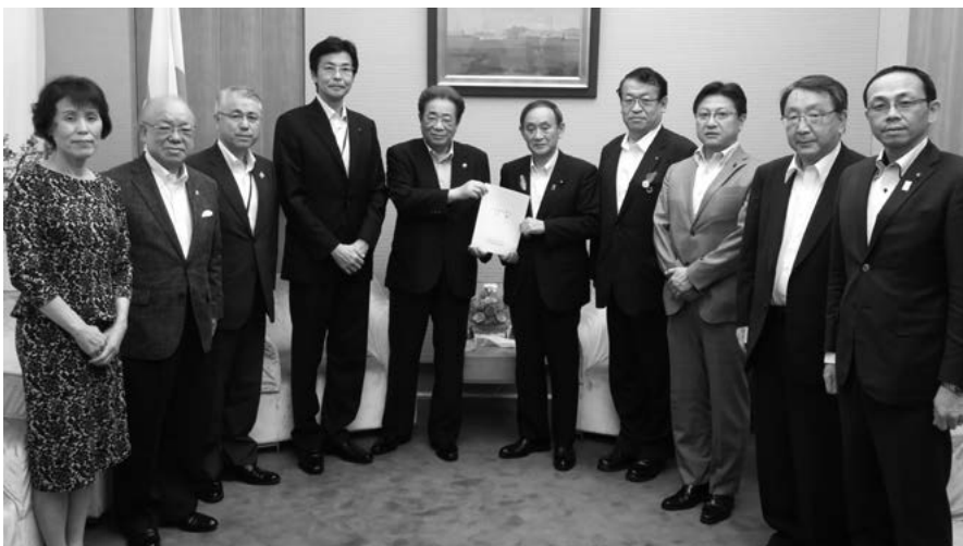
菅・内閣官房長官に要請