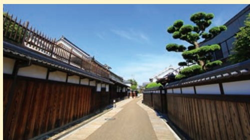
富田林寺内町(じないまち)は、大阪府内で唯一、国の重要伝統的建造物群保存地区に指定されており、現在でも江戸時代からの町並みが残る風情あるまちです。

※面積は国土地理院「全国都道府県市区町村別面積調」に、人口は「住民基本台帳」による。