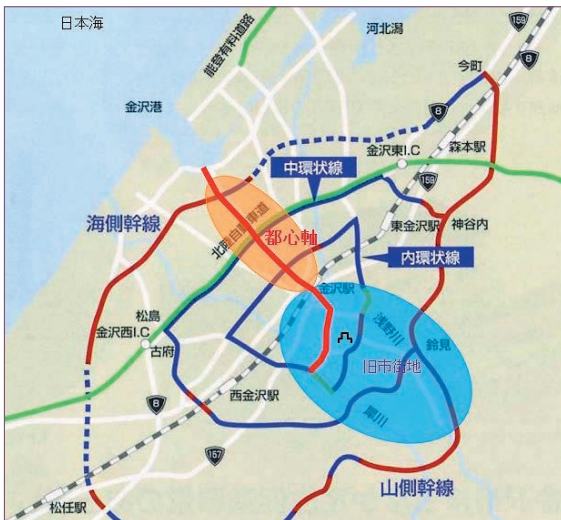
図2 保存と開発の調和

金沢市は、歴史に責任を負うま ちとして、「保存と開発の調和」を コンセプトにまちづくりを進め てきた。金沢城公園や兼六園をは じめとした歴史文化資産が多く 残る区域（図2の青色ゾーン）で は、これらと調和した伝統的なま ちなみ形成を図る一方、開発を優 先する都心軸沿道区域（図2の赤 線）では商業・業務機能を線的に 集積させ、高層建築物の立地を認 めるなど、保存と開発の調和を図 るためのきめ細やかな基準や ゾーニングにより、土地利用や景 観を誘導している。