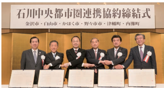
石川中央都市圏連携協約締結式

平成28年3月28日、本市を含む4市2町(白山市、かほく市、野々市市、津幡町、内灘町、金沢市)