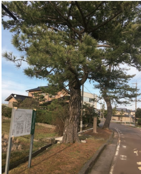
下口往還の松並木

18里35町52間(約74km)であった。加賀藩では、幕府の政策に従い、主な道路の左右に松を植えていたこともあり、松並木路として永く親しまれてきた。本市内において当時の面影を伝える風景は数少ないが、市北部の北森本町内には、下口往還の松並木が今でも残るほか、街道筋には、町家がよく残っているなど、当時の趣を随所に感ずることができる。