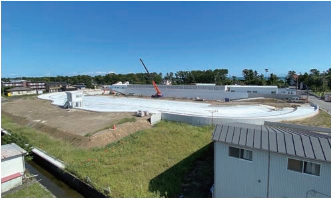
本年度完成予定のウエーブプール

では、若者を対象とした視点で事業を推進することが、本市の将来に求められるものと考え、「未来若者プロジェクト（若者を惹きつける自立したまちづくり）」を戦略プロジェクトとして位置付けました。本年は、