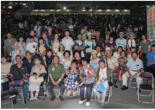
全国の「浜田さん」を花火大会にご招待

昭和60年代から合併前の各市町村が東京・大阪・広島に「ふるさと会」を設置し、現在も毎年、総会・交流会が行われています。平成17年からは「ふるさとメール」を始めました。市とご縁のある方に「メール会員」になっていただき、地元新聞社の協力を得て毎週1回、本市関連記事を配信していま