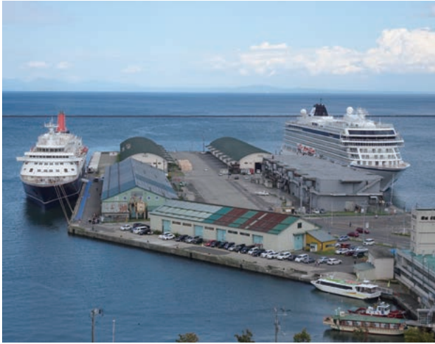
令和元年に開港120周年を迎えた「小樽港」

び周辺地区の再開発に官民一体となって取り組んでいるところである。大型クルーズ船に対応した岸壁や泊地の整備を進めているほか、乗船客の受け入れ環境改善のため、クルーズターミナルやバス駐車場の整備なども進めていくこととしています。