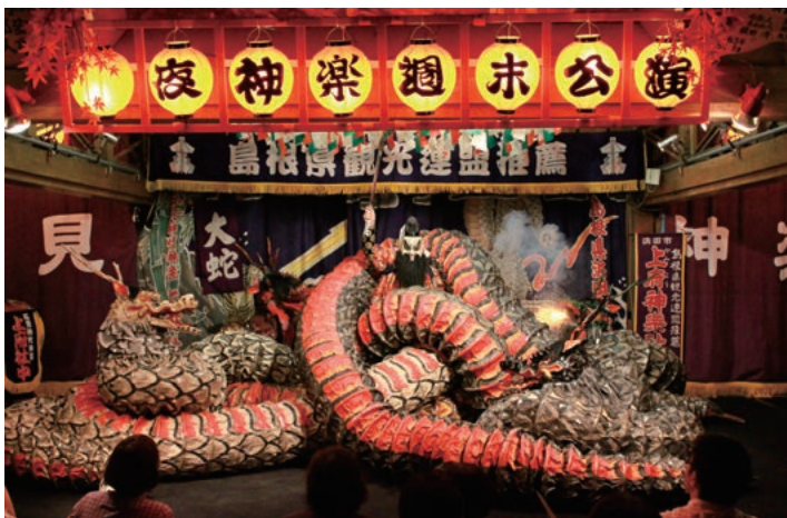
日本遺産に認定された「石見神楽」

出身）が、帰国後の記者会見で「のどぐろが食べたい」と語り、一躍有名になりました。この「のどぐろ」は「市の魚」にも制定されています。 観光の柱は日本遺産の「石見神楽」 観光の柱となっているのが「石見神楽」です。石見神楽は、古くから石見地方に伝わる伝統芸能です。石見9市町には130を超える神楽団体があり、中でも本市は最も神楽が盛んで、60近い神楽団体があります。毎週土曜日には、市内の神社で「夜神楽」公演が行われ、年に数回、大規模な神楽大会もあります。 この石見神楽は、本市を中心に石見9市町で日本遺産