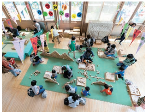
0～3歳までの乳幼児とその親を対象とする施設「0123はらっぱ」

開き、伸び伸びと育つことにより、まちが未来へと続きます。そのため、子どもを安心して産み育てられ、未来ある子どもたちが希望を持ち、健やかに暮らせるまちづくりを推進しています。