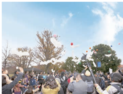
バルーンリリースなどを行う「平和の集い」

〔観光〕吉祥寺のまち、武蔵野クリーンセンター、武蔵野プレイス、井の頭自然文化園、武蔵野ふるさと歴史館 〔イベント〕武蔵野桜まつり、むさしの環境フェスタ、武蔵野吉祥七福神めぐり、吉祥寺アニメワンダーランド、EUSASHINOこちそうフェスタ、武蔵野イルミネーション