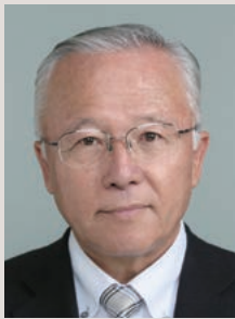
牧之原市長 杉本基久雄

2020オリンピックサーフィン競技の事前合宿場として活用できるよう関係者と調整しています。こうしたビッグプロジェクトを核として新たなまちづくりを進め、若者世代が魅力を感じる子育て、教育、雇用環境を実現することで、若者世代の交流・定住が促進され、にぎわいと希望に満ちた牧之原市の実現に努めていきます。