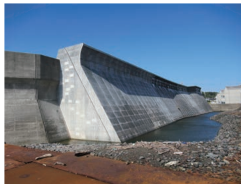
レベル1津波防潮堤工事が進む地頭方（じとうがた）漁港

将来的に大地震が予想されている静岡県にとって、東日本大震災が人口減少に与えたインパクトは非常に大きく、本市においても震災以降、津波の恐れがある沿岸