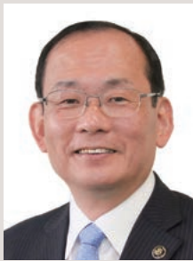
浜田市長 久保田章市