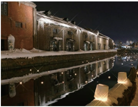
ろうそくの灯火が古い街並みを優しく照らす「小樽雪あかりの路」

夏に行われる「おたる潮まつり」は、小樽の成長を支えた海への感謝をテーマに市民がつくるイベントです。潮音頭に太鼓やみこし、花火の打ち上げが加わり、毎年多くの市民や観光客でにぎわいます。残念ながら新型コロナウイルス感染症の影響から、本年は、54回の歴史の中で初めて中止となりました。