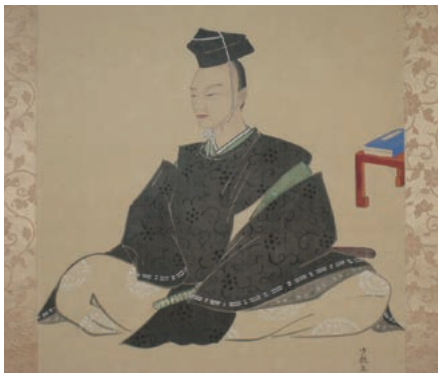
今、再評価される田沼意次侯

また、市に所縁のある歴史上の人物として田沼意次侯が挙げられます。遠州相良藩の藩主であった意次侯は、江戸幕府老中として幕府の財政立て直しに取り組みまし