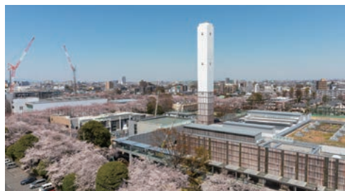
まちに溶け込みまちにつながる「武蔵野クリーンセンター」

と市民の「情報共有」、市政への「市民参加」の保障、この二つにより「協働」して公共的課題の解決を図っていくこと、市の長期計画をはじめとする「計画に基づく市政運営」の四つを自治の基本原則として規定しています。