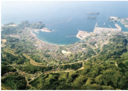
「浜田港」(左)と「浜田漁港」(右)を望む

浜田市は、島根県西部（「石見」地方）のほぼ中央に位置するまちです。古くからの歴史があり、律令時代には「石見国」の国庁が置かれていました。江戸時代の元和5年（1619年）、浜田藩が設置