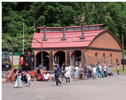
日本遺産「北の産業革命『炭鉄港』」の構成文化財「旧手宮鉄道施設」(国指定重要文化財)

本市は、文化庁より日本遺産「北前船寄港地・船主集落」と「北の産業革命『炭鉄港』」の認定を受けています。北前船とは、明治期以降に北海道の産物を本州へ運び、反対に本州から北海道に生活物資などを運んだ和式帆船の通称です。炭鉄港とは、北海道の近代化を支