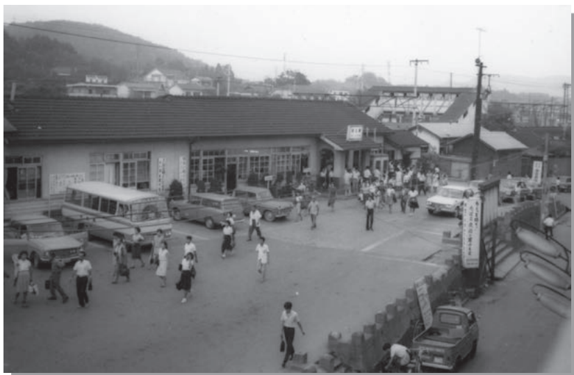
昭和42年頃の相生駅

昭和47年には「相生駅」に新幹線が発着するようになりました。駅舎の大改修をはじめ、市内の様子も大きく変わりました。兵庫県西部に位置する西播磨地域や、隣接する岡山県を訪れるビジネス客や観光客の玄関口として、重要な役割を担っています。