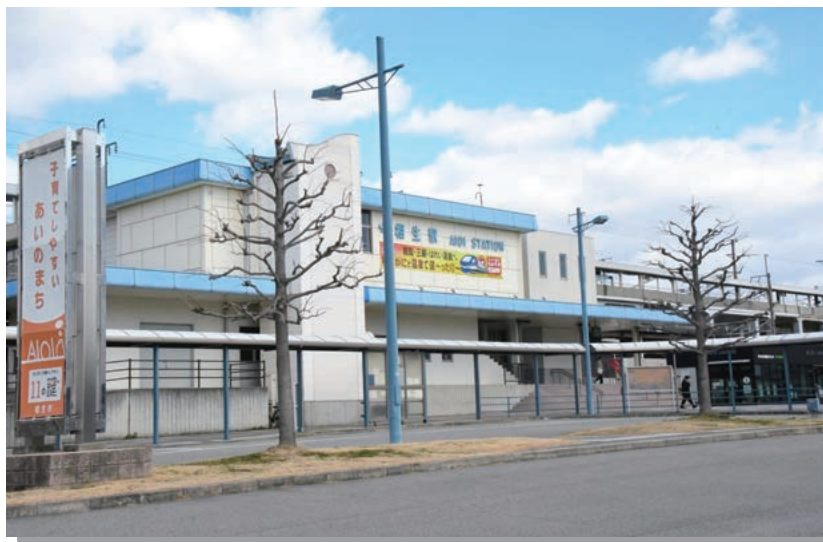
山陽新幹線開業50周年を 迎えた相生駅