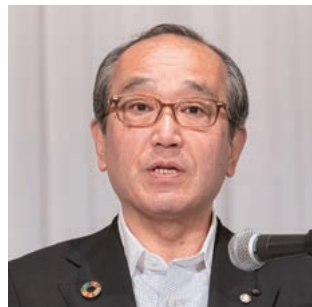
副会長：松井・広島市長