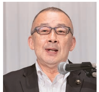
旧役員を代表してあいさつをする 江里口・小城市長