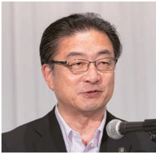
副会長：米沢・帯広市長