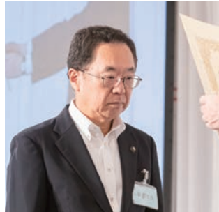
永年勤続特別功労表彰を受ける河上・熊野市長