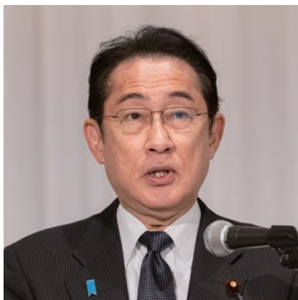
岸田・内閣総理大臣祝辞