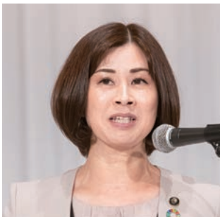
副会長：末松・鈴鹿市長