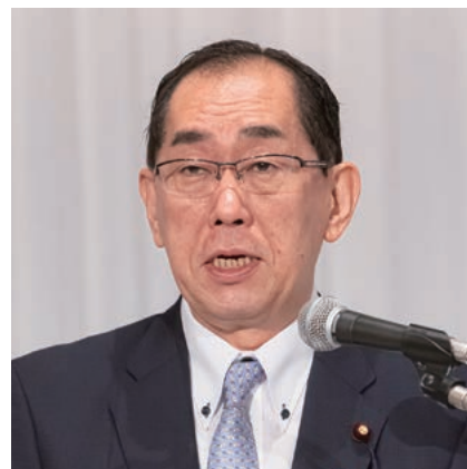
松本・総務大臣祝辞