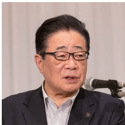
会長の立谷・相馬市長