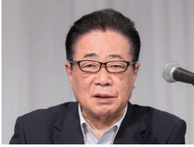
会長の 立谷・相馬市長