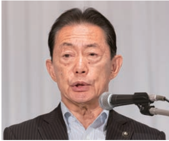
正副会長候補者選考委員会座長の 井崎・流山市長