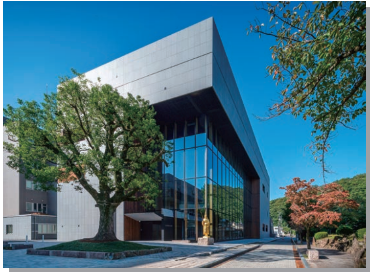
リニューアルオープンした 平櫛田中美術館