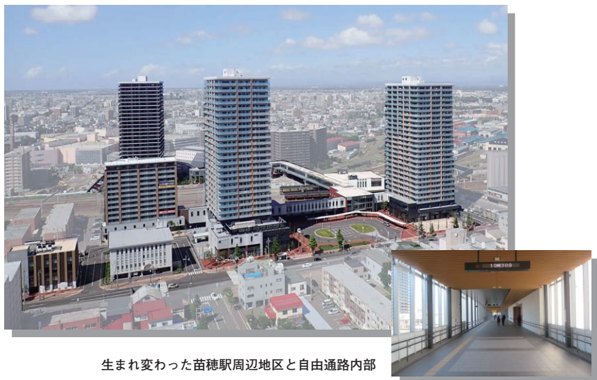
生まれ変わった苗穂駅周辺地区と自由通路内部