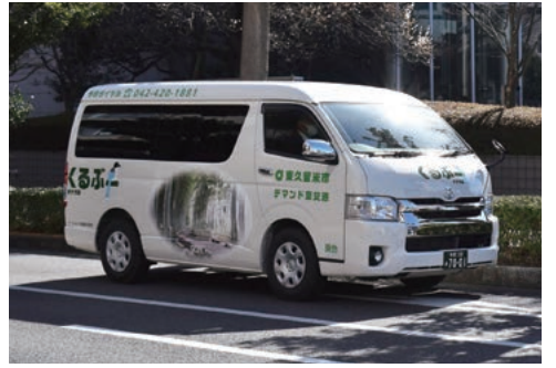
市役所前を走る東久留米市デマンド型交通「くるぶー」

育て世帯や高齢者を対象として、都内では初の試みとなる市内全域を対象地域としたデマンド型交通「くるぶー」の実験運行を、令和2年3月より開始いたしました。デマンド型交通は多くの自治体が運行しているコミュニティバスに比べ、経費が安く済むメリットがあり、新たな公共交通手段の取り組みとして注目されています。