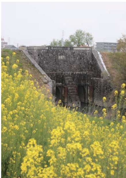
たたき工法で造られた五六開門

市の南部には市内を流れる18本のうち、12本の河川が流れ込んでいる犀川遊水地があり、その治水