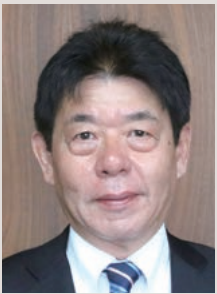
美作市長 萩原誠司

〔まちの特徴〕地域全体に緑の豊かな山々と、清らかな川の流れ、その周辺に広がる田園などが調和して落ち着いた景観を形成