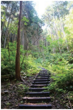
整備された森林と遊歩道

手入れが行われず荒廃した山林を都市公園として整備し、更新伐事業で森林整備を行っている他、森林経営管理制度においては、人