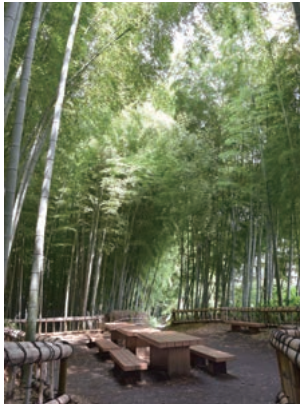
「新東京百景」に選ばれた竹林公園

選」に選ばれました。また、無数の孟宗竹に囲まれ、園内はいつも静寂に包まれている「竹林公園」は、「新東京百景」の一つに選ばれています。こうした豊かな自然に恵まれた本市では、真夏でも市内の湧水を集めて流れる小川で遊ぶ、元気な子どもたちの声が聞こえます。また、本市はいまだ多くの農地が残されており、都市農業が盛んです。本市でのみ栽培されている「柳久保小麦」は、戦時中に栽培が途絶え、一時は「幻の小麦」となった品種を復活させたもので、市内の農業者が協力して現在も栽培を続けています。「柳久保小麦」は粘りが強く、香りや風味が優れていることから、市内のさまざまな特産品に利用されています。こうした本市の魅力を国内にと