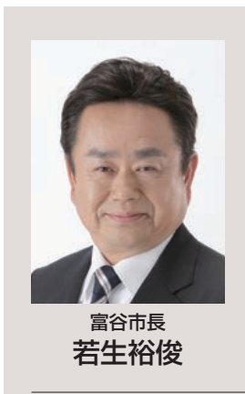
富谷市長 若生裕俊

本市は若い世帯が多く、子どもの数が多いということも特徴の一つです。富谷の大切な宝である子どもたちを、市民みんなで育てていきたいという思いの下、「教育と子育て環境を誇るまちづくり」を進めています。その一つとして、日本ユニセフ協会から「日本型子どもにやさしいまちモデル検証作業自治体」として委嘱を受け、平成30年11月20