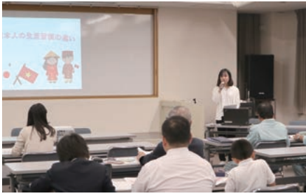
市の職員として活躍するダナン大学卒業生

つあります。全国の自治体のうち、半数以上が消滅する可能性がある」とされている中で、自分たちの地域文化を残すためには、外国人が産業の担い手であるのみならず、文化や社会の担い手でもあることを認識し、肯定的に捉えることが大切であると考えています。