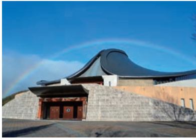
宮本武蔵顕彰武蔵武道館