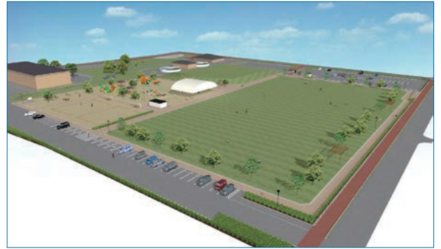
「(仮称)中山道大月多目的広場」完成予定図

る芝生を中心とした広場」をコンセプトに、地方創生の視点も加えた整備を進めているところで、令和4年度のオープンを予定しています。県内でも有数の大きな遊具と芝生広場を備え、その周辺には、隣接する子どもの読書活動推