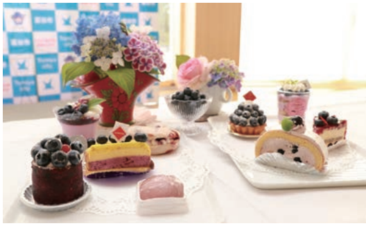
毎年大人気のブルーベリースイーツフェア

のです。4年前からスタートした「とみやちみつプロジェクト」により、市民の皆さまにミツバチの世話をお願いし、令和2年は190kgものちみつが採れました。まさにこれは、自然豊かな住環境の中、本市らしい市民協働の取り組みです。