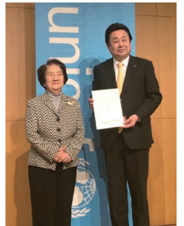
「日本型子どもにやさしいまちモデル検証作業自治体」として日本ユニセフ協会と連携

〔特産品〕ブルーベリー、はちみつ、地酒、シャインマスカット、イチジク 〔観光〕富谷宿観光交流ステーション(とみやど)、大亀山森林公園、ブルーベリーつみとり農園、大黒澤苑 〔イベント〕とみやブルーベリースイーツフェア、とみやマーチングフェスティバル、街道まつり、秋のとみやスイーツフェア、七ツ森ハーブマラソン大会