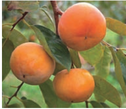
瑞穂市発祥の「富有柿」

所として栄えました。近年でも、JR東海道線穂積駅から中部地方最大の都市である名古屋市のターミナル駅、名古屋駅まで約25分という交通至便の要衝であり、都市としての魅力も備えた住環境に富んだまちです。 平成15年の市制施行より人口増加が続いており、約8000人増えていますが、本市においても少子高齢化が一層進む「2040年問題」は、決してなおざりにできません。その対策として、将来を見据え、地方創生に一層力を入れて取り組んでいきたいと考えます。地方創生は地方のにぎわいを創出することが目的ですが、その本質は「ふるさとを愛する心」を育むことです。その足掛かりとして、現在地方創生の三つの拠点づくりを進めています。