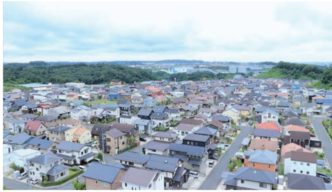
住宅地と自然が調和したまち並み

富谷市は、宮城県のほぼ中央に位置し、緑豊かな地域と住宅地が共存するまちです。南北に東北自