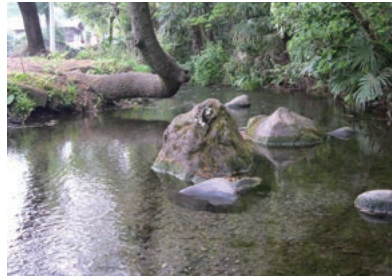
南沢緑地保全地域内の沢頭（さがしら）湧水

東久留米市は人口約11万7000人、東京の都心部から北西へ約24km、武蔵野台地のほぼ中央に位置し、