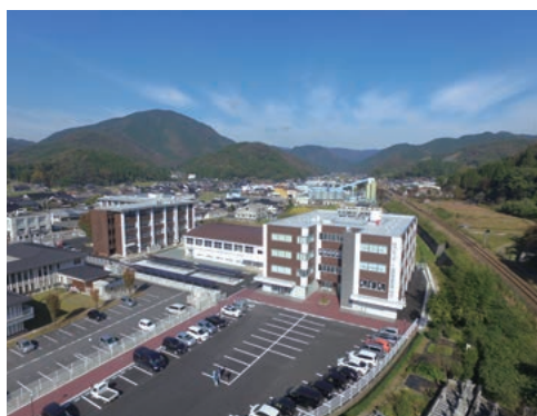
美作市スポーツ医療看護専門学校

人口減少対策として、市内に移住して賃貸住宅に居住する、ひとり親世帯への家賃補助を新たに制度化しており、前述の養成研修と併せて事業を展開することで、女性の活躍の場の創出や、ひきこもり状態の方の社会参加意欲の向上につなげてまいります。