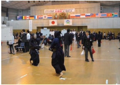
お通杯の試合の様子