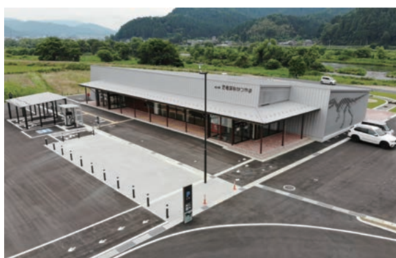
道の駅「恐竜渓谷かつやま」

の福井駅開業、令和8年中とされる中部縦貫自動車道の福井県内全線開通により、関東圏とのアクセスが飛躍的に向上します。中部縦貫自動車道勝山インターチェンジから5分の、九頭竜川沿いに建設した道の駅「恐竜渓谷かつやま」の周辺エリアとして一体的にウエルカムゾーン整備を進めています。また、福井県立恐竜博物館は令和5年夏のリニューアルオープンに向けて、大規模改修を進めています。市は福井県立恐竜博物館