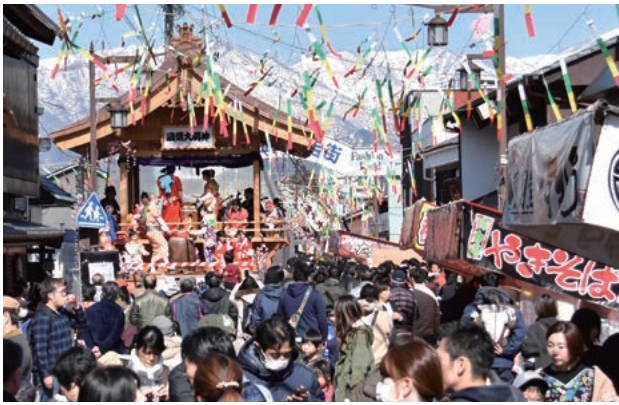
勝山左義長まつり