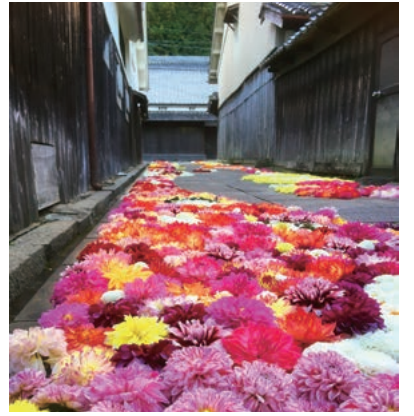
ダリアに彩られた宇陀松山重要伝統的建造物群保存地区

ゾーンを設定して、積極的に農業を活性化させていきます。県東部で初めての「特区」の設定となっ