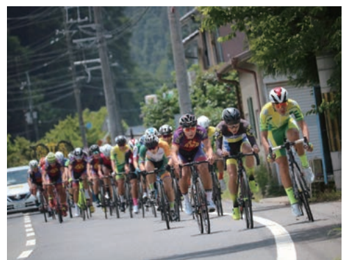
近畿高等学校自転車競技大会

〔特産品〕毛皮革製品、吉野本葛、ダリア、大和茶、磨き丸太、宇陀金（ごぼろ）、黒大豆 〔観光〕室生寺（日本遺産）、又兵衛桜 またへえぎくら 、奈良力エテの郷ひらら、平成榛原子供のもり公園、室生山上公園芸術の森、宇陀松山重要伝統的建造物群保存地区 〔イベント〕あきの螢能、うたの秋まつり、宇陀市は いばら 花火大会、宇陀シティマラソン、うだ産フェスタ