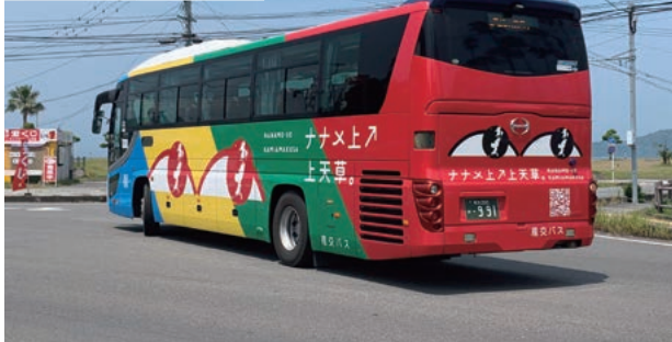
「ナナメ上ノ上天草。」のラッピング

トが観光地を巡る動画などを制作し、関連サイトで配信したところ、多くの方にご覧いただき、高い評価を得ました。