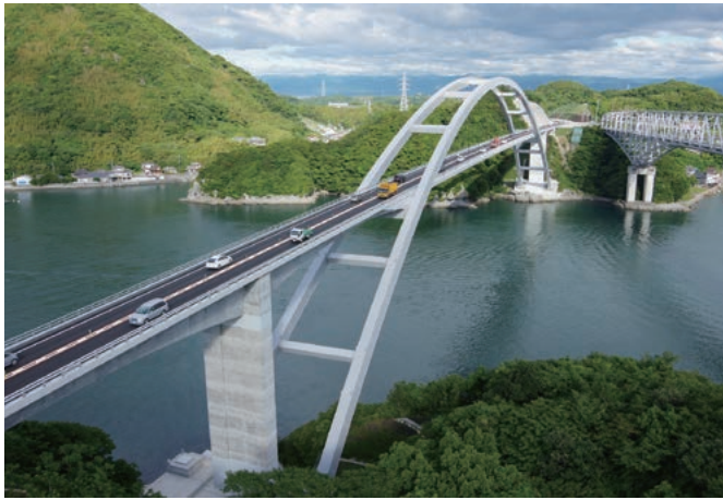
天草の玄関口に新たに誕生した新1号橋(天城橋)

上天草市は、熊本県の西部、有明海と八代海が接近する天草地域の玄関口に位置し、大矢野島、天草上島、その他の大小多くの島々