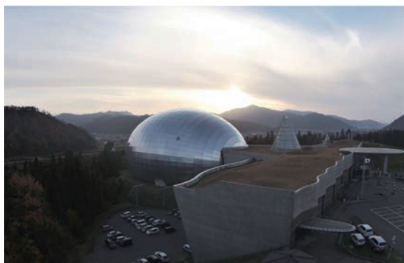
福井県立恐竜博物館

の福井駅開業、令和8年中とされる中部縦貫自動車道の福井県内全線開通により、関東圏とのアクセスが飛躍的に向上します。中部縦貫自動車道勝山インターチェンジから5分の、九頭竜川沿いに建設した道の駅「恐竜渓谷かつやま」の周辺エリアとして一体的にウエルカムゾーン整備を進めています。また、福井県立恐竜博物館は令和5年夏のリニューアルオープンに向けて、大規模改修を進めています。市は福井県立恐竜博物館