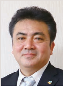
上天草市長 堀江隆臣