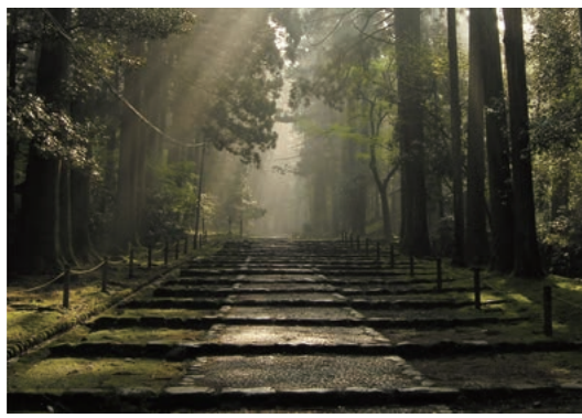
国史跡白山平泉寺境内

年に、越の大徳と 称された泰澄に よって開かれた 平泉寺白山神社 は、1300年の