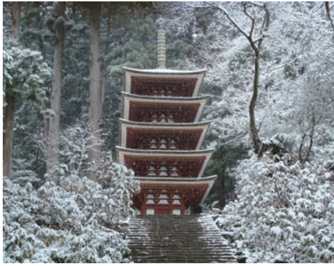
日本遺産 女高野・室生寺

宇陀市は、奈良県の北東部にあり大和高原と呼ばれる地域で、大阪・名古屋からのアクセスもよく、夏でも冷涼で過ごしやすいく所、に位置しています。古事記や日本書紀、万葉集の歴史の舞台になっている本市は、日本遺産である女