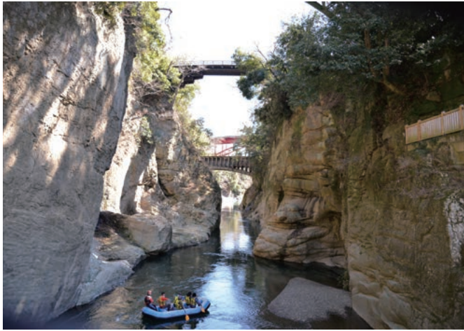
桂川と日本三奇橋の猿橋

大月市は、山梨県の東部に位置し、首都東京は東に約75km、県都甲府市は西に約35kmの距離にあり、両都市圏とは市の南部を東西