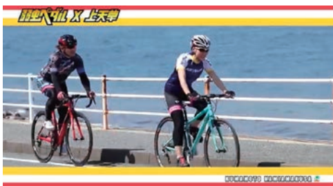
弱虫ペダル×上天草コラボ動画

ナナメ上とは、市内にある豊富な資源に磨きをかけることで予想を裏切り、超えてくるという意味で、ロゴも企むようにナナメ上を見つめる瞳の中に、本市の地形を写しています。このロゴは、観光ブランドイングコ