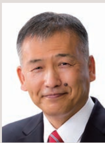
勝山市長 水上実喜夫