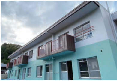
遊休施設を改修したサテライトオフィス

ン（ローソン大月1丁目店）がオープンし、桃太郎関連の商品を販売しPRしております。 さらに、令和3年4月1日に本市産業建設部産業観光課の別称として「大月桃太郎課」を発足し、シタイプロモーションを推進しております。 グリーンワーケーション 新型コロナウイルスの出現により、テレワークやサテライトオフィスの整備など働き方改革が進む中で、都心から電車で1時間という地理的な優位性を生かし、都市と地方の双方に生活と仕事の拠点を持つ「二拠点居住」の推進に力を入れております。