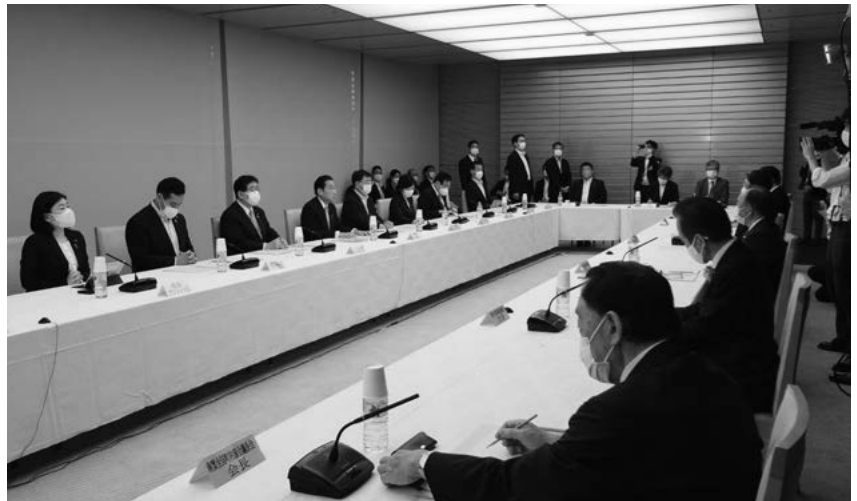
挨拶をする岸田・内閣総理大臣

#7 「新型コロナウイルスの4回目接種に関する緊急要望」を内閣官房、厚生労働省、総務省に提出