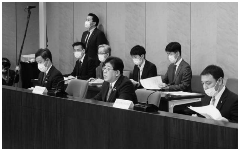
要請を行う金子・総務大臣