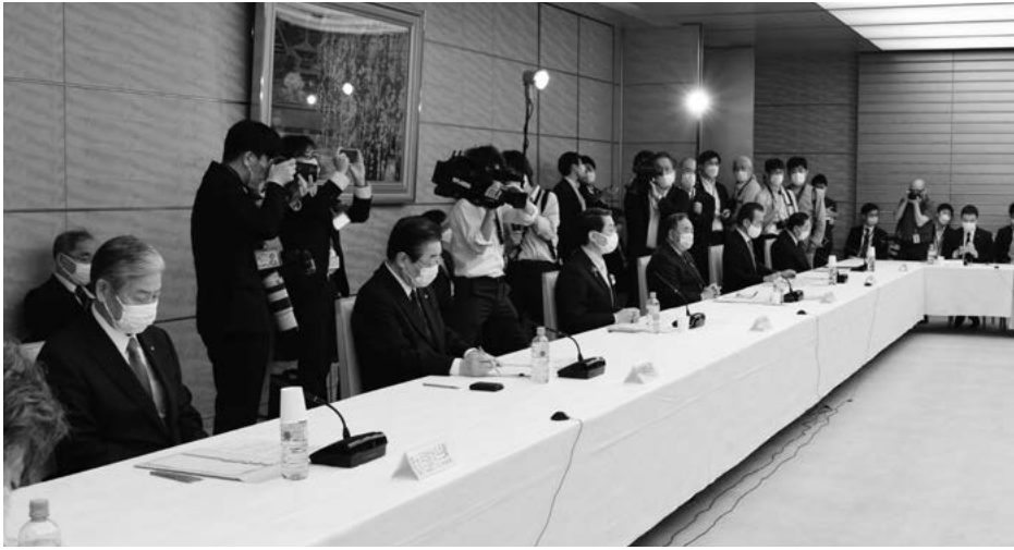
地方六団体代表者（左から2人目が立谷会長）