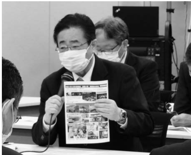
発言する立谷会長

詳細につきましては、全国市長会ホームページ ( https://www.mayors.or.jp/ ) をご参照ください。