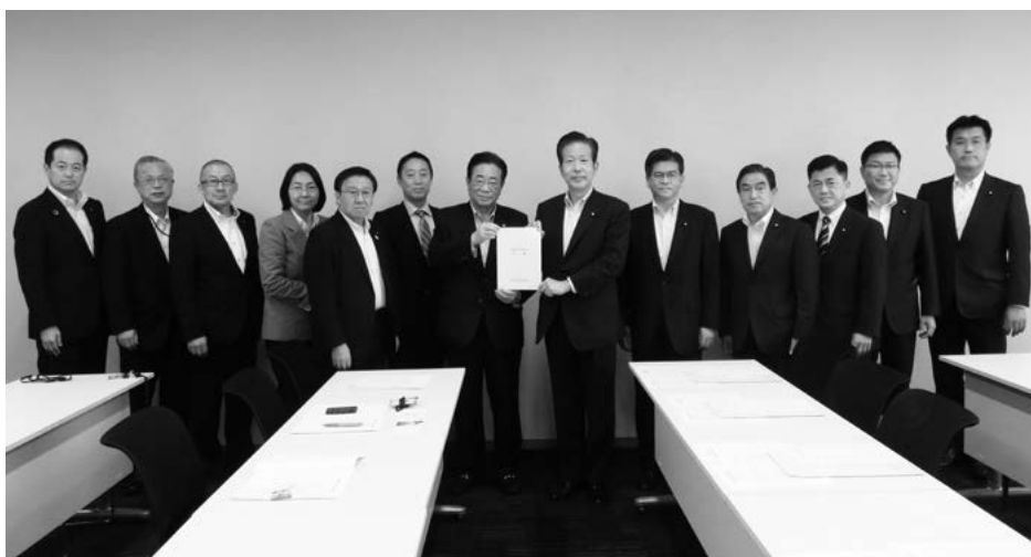
公明党の山口・代表（右から6人目）、石井・幹事長（右から5人目）などに要請