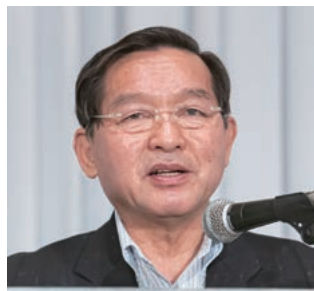
財政委員長の牛越・大町市長