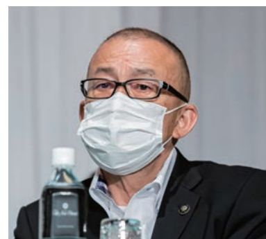
江里口・小城市長