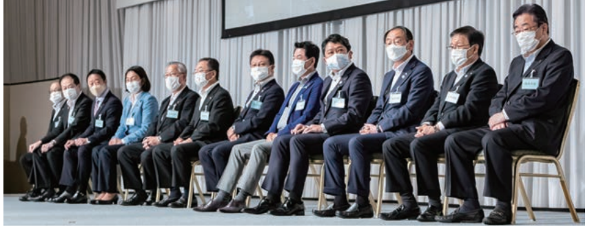
満場一致で選出された新正副会長