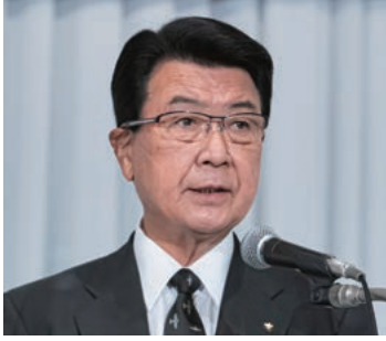
正副会長候補者選考委員会座長の山口・千歳市長