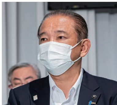
本村・相模原市長