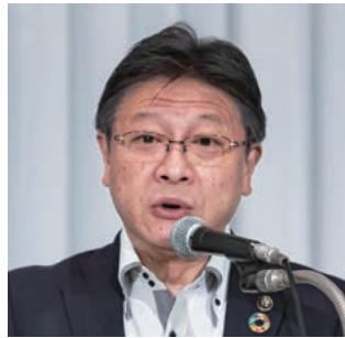
副会長：田辺・静岡市長