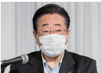
会長の立谷・相馬市長