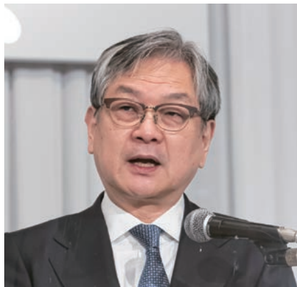
岸田・内閣総理大臣祝辞(代読)栗生・内閣官房副 長官