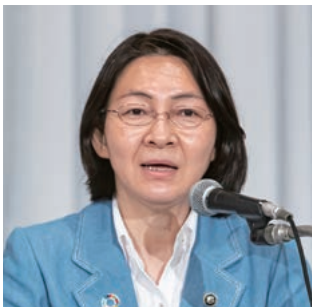
副会長：伊東・倉敷市長