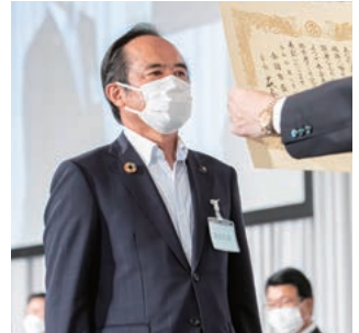
特別功労表彰を受ける神谷・安城市長