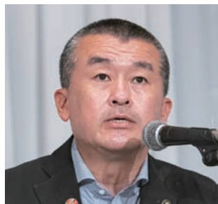
社会文教委員長の吉田・本庄市長