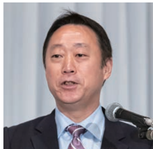
副会長：福田・岩国市長