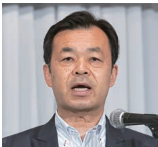
行政委員長の辻・和泉市長