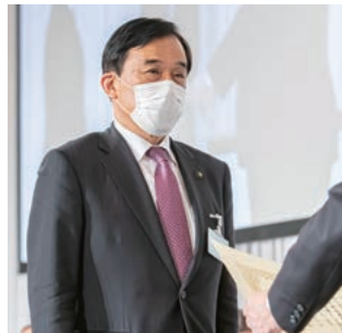
永年勤続特別功労表彰を受ける横尾・多久市長