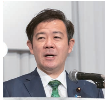
金子・総務大臣祝辞(代読)田畑・総務副大臣