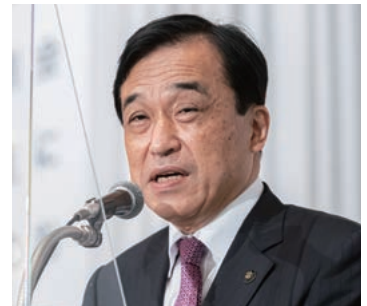
被表彰市長を代表してあいさつする横尾・多久市長