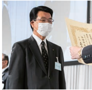
特別功労表彰を受ける山口・千歳市長