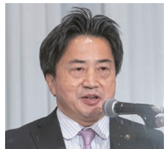
経済委員長の片岡・総社市長