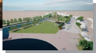
現在と今後生まれ変わる天王川公園