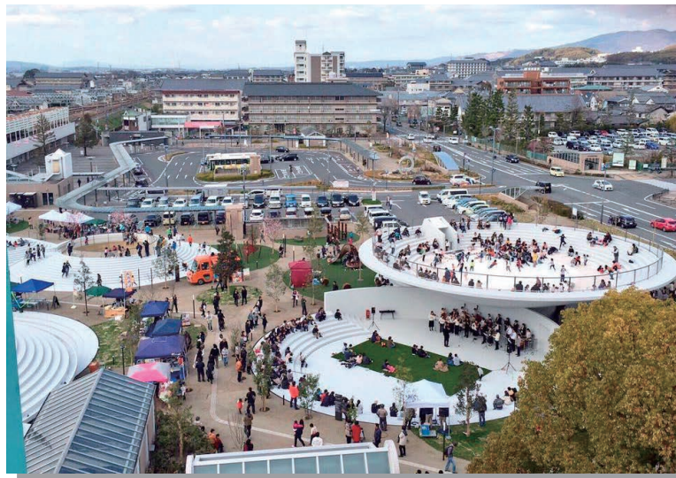
CoFuFun (コフファン) 多くの人でにぎわいます。