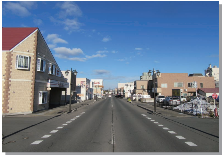
令和5年の中心市街地