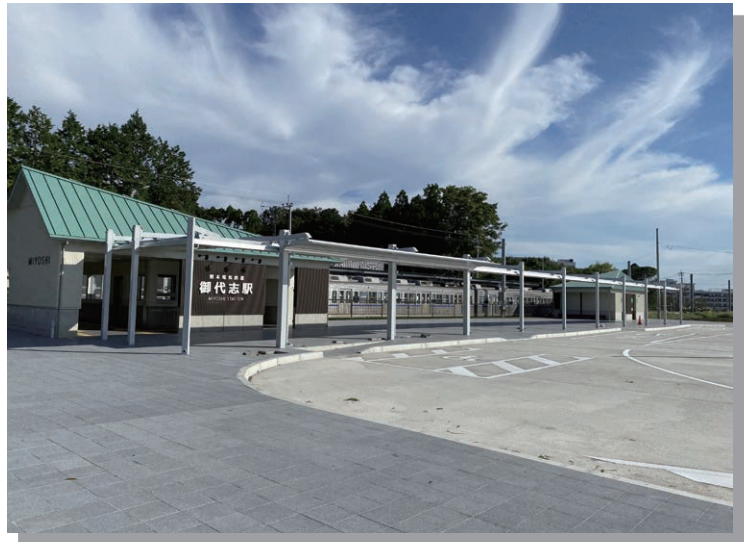
電車、バス、タクシーが集まる 公共交通の要所