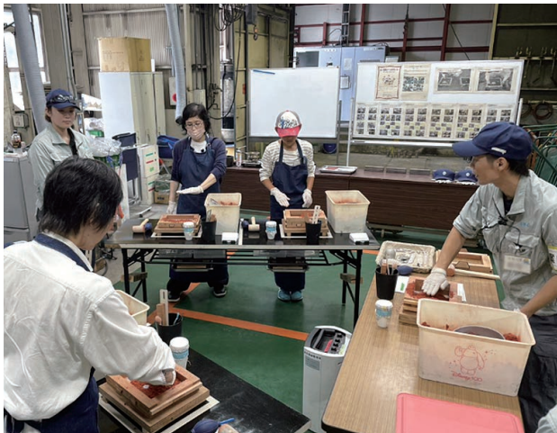
日進市の多彩な魅力を市内外の人々に体感してもらう夏・秋恒例の「日進ツアーズ」の様相(写真は中央可鍛工業㈱鑄造体験)

合わせ、必要な情報を随時発信することなどで子育て世代の関心を喚起し、多忙な子育て世代の手間を省きつつ、継続的な支援を行えるよう努力を重ねている。 「マイナンバーカードの活用については、カードの格納情報や表面記載情報を読み取り自動入力する機能を持つ『スマート窓口システム』を使って、市民の皆さまや職員の書類記入の手間を減らすなど、市民サービスレベルの向上や業務の効率化をさまざまな形で図っております。 さらに令和6年に実施された衆議院議員選挙からは、マイナンバーカードによる本人確認と名簿対照を行う、選挙投票入場受付サービスが実装されました。その他、マイナンバーカードからの情報はオンライン粗大ごみ