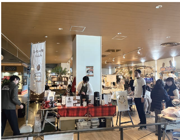
令和6年からスタートした、市民参加型の新たなイベント「コーヒーの街にしんプロジェクト」の様相

合わせ、必要な情報を随時発信することなどで子育て世代の関心を喚起し、多忙な子育て世代の手間を省きつつ、継続的な支援を行えるよう努力を重ねている。 「マイナンバーカードの活用については、カードの格納情報や表面記載情報を読み取り自動入力する機能を持つ『スマート窓口システム』を使って、市民の皆さまや職員の書類記入の手間を減らすなど、市民サービスレベルの向上や業務の効率化をさまざまな形で図っております。 さらに令和6年に実施された衆議院議員選挙からは、マイナンバーカードによる本人確認と名簿対照を行う、選挙投票入場受付サービスが実装されました。その他、マイナンバーカードからの情報はオンライン粗大ごみ