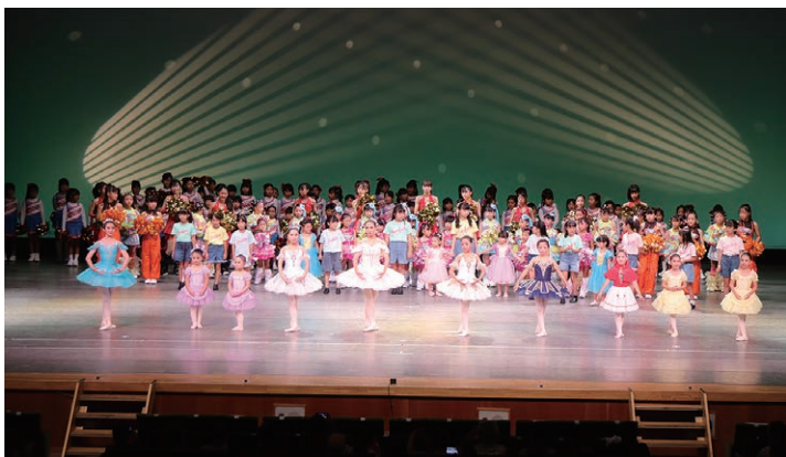
若者のための舞台発表・体験会「にっしんヤングフェスタ」。毎年開催の恒例イベントだが、令和6年は市制施行30周年記念でひとときを盛大に開催された(市民会館)

最大の基盤は 大都市圏に位 置することに よる居住環境 の良さ、就労 環境、通勤・ 通学環境の良 さなどと、貴 重な自然環境 とのバランス にあると思っ ています。