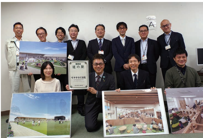
「道の駅 マチテラス日進」の登録および建設計画を推進したプロジェクトチームが「市政ルポ」取材で大集合!!