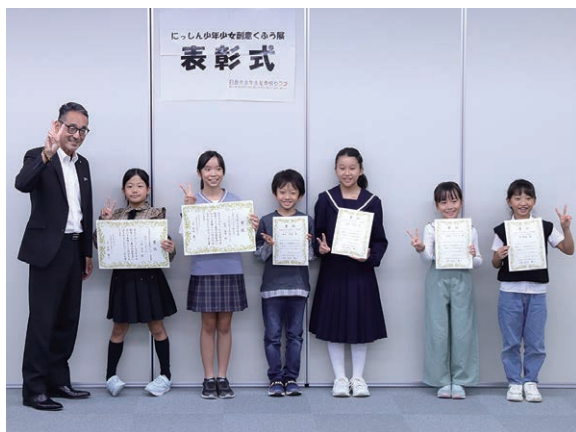
市内在住の小中学生が自慢のアイデアや夢を形にする発明作品展「にっしん少年少女創意くふう展」表彰式の一コマ(市民会館)

持ってもらえるようなま ちづくり、地域の人々が 安心して子育てできるよ うな環境づくりを、市制 施行30周年を機に、さら に推進していきたいと考 えております。 例えば最近、日進市は 10万人規模のインター ネット調査を基にした『街 の幸福度 自治体ランキン グ(東海版)』で1位になり ました。日進市が『選ばれ