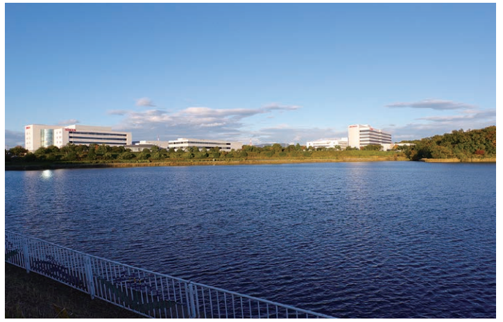
愛知県の尾張丘陵部から知多半島にかけて建設された愛知用水の中間点に位置する広大な「愛知池」(日進市・東郷町・みよし市)

最大の課題の一つは、DXの導入が代表するような、効率化に不可欠な「デジタル化の推進」といわれる。しかし、重要なのは単なるデジタル化(システム導入)の推進ではない。市職員はもとより、市民がいかにそれを有効活用できるか。行政がいかにそのような状況に導くことができるかにかかっている。 例えば、日進市が市民に提供している子育て関連アプリ(にしん子育てアプリ「Nぴよ」)についても、活用度は非常に高いという。全国的に遅れ気味なマイナンバーカードの有効活用においても同様だ。日進市ではマイナンバーカードの公的個人認証機能を活用し、健診や予防接種などに関しては月齢や年齢に