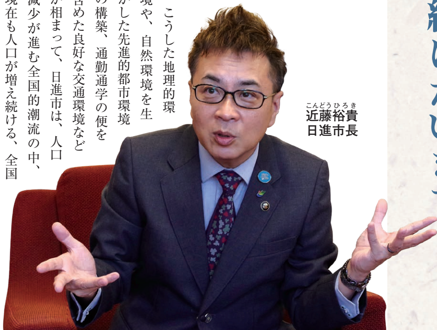
こんどうひろき 近藤裕貴 日進市長

こうした地理的環 境や、自然環境を生 かした先進的都市環境 の構築、通勤通学の便を 含めた良好な交通環境など が相まって、日進市は、人口 減少が進む全国的潮流の中、 現在も人口が増え続ける、全国 的にも稀有な都市の一つとなっている。 市制施行した平成6年の段階で5万 3228人だった日進市の人口は、市制施行 10周年の平成16年の時点で7万3750人 に、20周年の平成26年の時点で8万6099