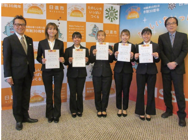
観光まちづくり人材の育成を目的に愛知学院大学とつしん観光まちづくり協会・日進市が協働開催する「産官学連携講座」の受講・修了生たちに市長から「観光SDGs修了認定書」を授与

ヒューマンケア学部附属子どもケアセンター内「子育て支援センター」を訪ねることができた。日進市との連携関係を通じて開設（委託）され、大学のヒューマンケア学部の知見を活用し、学生が授業やボランティアで関わる「子育て支援の場」という意味合いにおいて、この「子育て支援センター」は、全国的にもユニークな施設といえる。