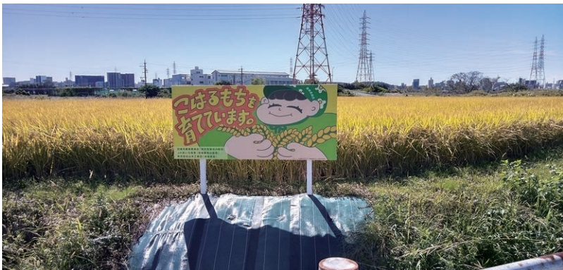
日進市で育てた県奨励品種のもち米「こはるもち」は今や日進市の特産品として大人気だ

人に、30周年の令和6年10月1日の時点で9万4140人にと、順調に増え続けてきた。また日進市の人口増は1960年代以降、旧日進町時代から持続中で、同エリアの人口増は半世紀以上にわたり続いていることになる。 近年発表される各種の「住み良さランキング」などにおいても、日進市は常に県内上位5市に含まれ、全国でも上位50位以内の常連として、高い評価を受けている。