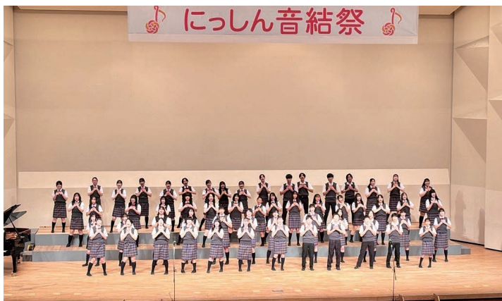
「音楽のまち にっしん」を目指し令和2年から開催されている音楽祭「にっしん音結祭」。令和6年は市制施行30周年記念として開催された(市民会館)