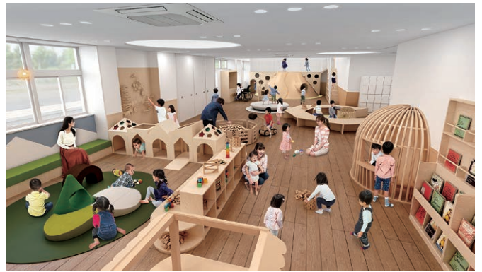
「道の駅 マチテラス日進」の外観と「子育て支援施設・プレイルーム」のイメージパース。令和7年8月8日の開駅が待ちきれない!!