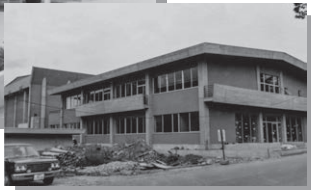
リノベーション前