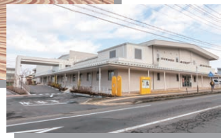
市民会館「ソラホール」 令和6年にリノベーションが完了