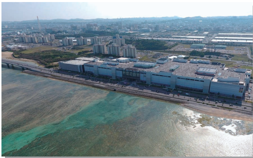
大型商業施設が立地 左手は橋梁化した道路