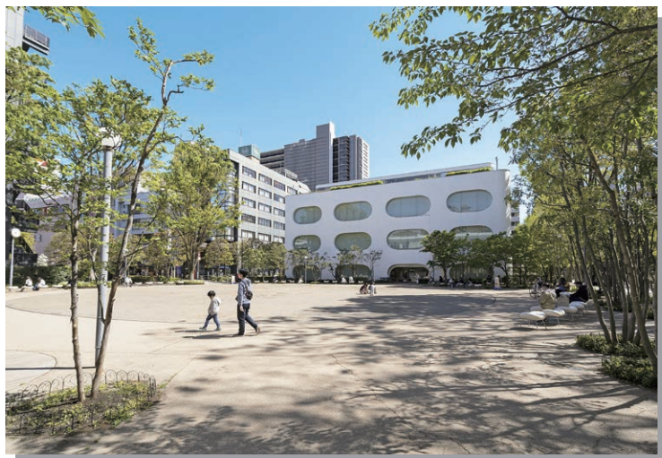
駅前の境南ふれあい広場公園 から臨む武蔵野プレイス