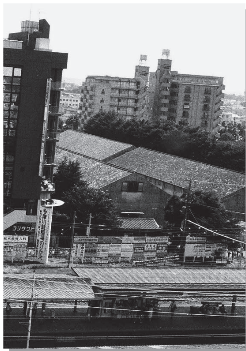
当時は雑木林に囲まれた農水省食糧倉庫