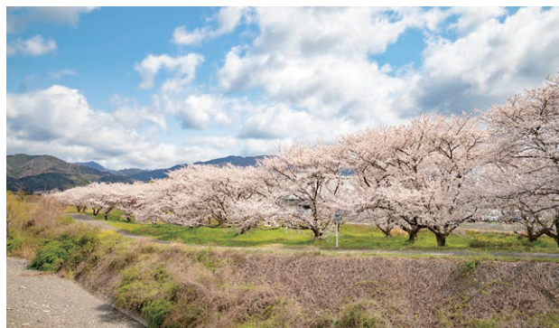
重信川河川敷の春の風物詩として知られる見事な桜並木