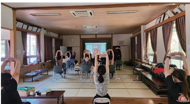
市民および市内企業従事者の健康増進を目指しMaaS車両の内外で実施されるスマートヘルスケア事業

ムをはじめとする最新のデジタル機器を搭載した車両(ヘルスケアMaaS車両)を、中山間地や市内企業、公共施設、公民館、各種事業所などに派遣する。そして、健康相談や健康講座・運動講座などの実施、さらには内臓脂肪測定や認知度チェックなどの各種検査を現地で行うことにより、医師はもとより、相談者も移動負担のないままに目的を達することができる仕組みだ。