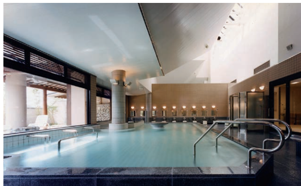
温水プールやトレーニング室も備えた日帰り温泉施設「東温市ふるさと交流館／さくらの湯」は、市内内外を問わず人が訪れる交流拠点施設だ

東温市一帯には旧温泉郡の郡名の由来でもある地域資源として、優れた泉質（主に神経痛や筋肉痛などに治療効果のあるナトリウム塩化物・炭酸水素塩温泉など）の温泉も湧出している。宿泊設備を備えた大規模温泉施設や日帰り温泉施設があり、市内外から訪れる湯客・観光客などによる「にぎわいの場」を創出している。