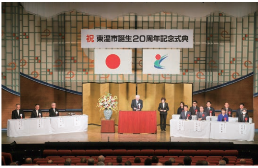
「坊っちゃん劇場」で華々しく開催された市制施行20周年記念式典（令和6年9月21日）