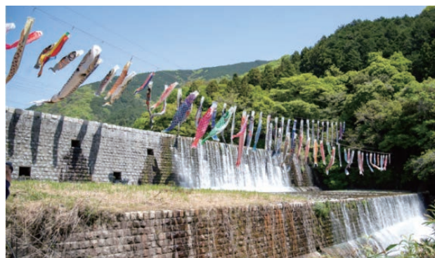
ゴールデンウィーク前後に山之内地区自治会が重信川「除けの堰堤（よけのえんてい）（国指定登録有形文化財）」で行う「鯉のぼりの架け渡し」は観光客にも大人気

よび13の歯科医院があり、ベッド数は総計1135床に上ります。そして、愛媛大学医学部附属病院の周産母子センターを軸に、地域の診療所と病院の連携で図る周産期医療から高度医療までも含め、全ての年代の市民・関係者に、地域完結型の医療を提供することが可能な態勢が構築されています。