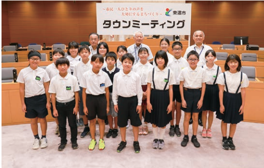
「市民一人ひとりの声を大切にすまちづくり」の要・タウンミーティングは毎年開催。写真は市制20周年記念「子どもミーティング」の様