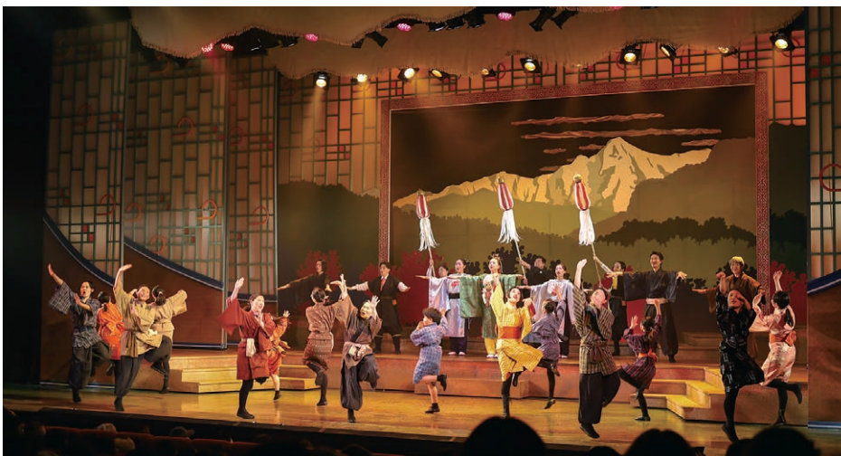
市制施行20周年記念事業の目玉は重信川がテーマの「東温市民ミュージカル」の上演（於・坊っちゃん劇場）