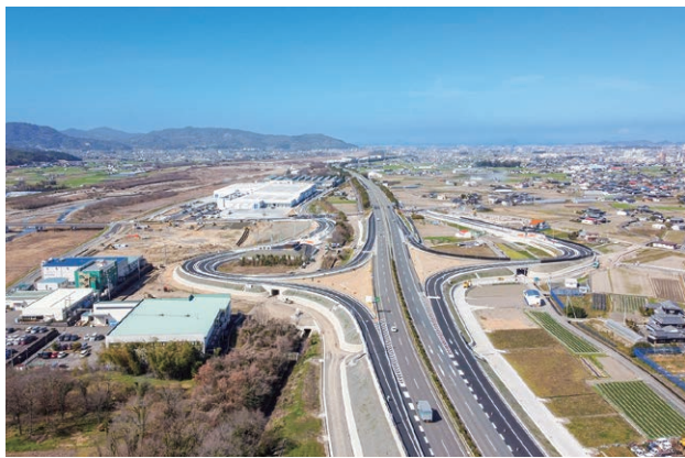
東温市の地域経済に大きな波及効果をもたらしつつある松山自動車道・東温スマートICの開通