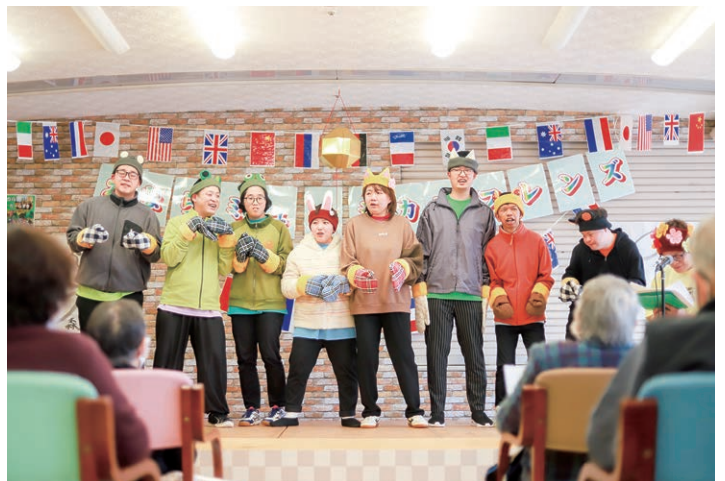
愛媛県立みなら特別支援学校のOBが結成する「ミュージカルフレンズ」による介護施設での公演。「舞台芸術の聖地化」は全市民参加の文化運動でもある

を楽しみ、絶景を巡るコースなどを組み合わせさせた動画をYouTubeで公開。さらには、モニターツアーを随時行うなど、ニーズを広範に探るための地道な取り組みが進められてきた。