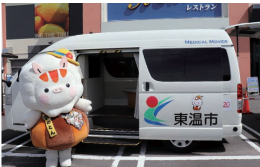
「どうおんスマートヘルスケア創出」事業の先導役として活躍のヘルスケアMaaS車両(お披露目式)

「どうおんスマートヘルスケア創出」事業の根幹を成すシステムとしては、中山間地域の市民や企業の従業員などと、医療機関の医師などを遠隔医療システムで結ぶ《オンライン健康相談》と、Webシステムを使った簡易認知測定《あたまの健康チェック》、さらにはスマートフォンで健診情報やバイタルなどを登録することで、事業参加者の健康維持を支援する《健康アプリを活用したサービス》に大別できる。前出「移動型健康サポート事業/いきいきマース」は、これらのサービスを円滑に、もれなく実施するため、遠隔医療システム