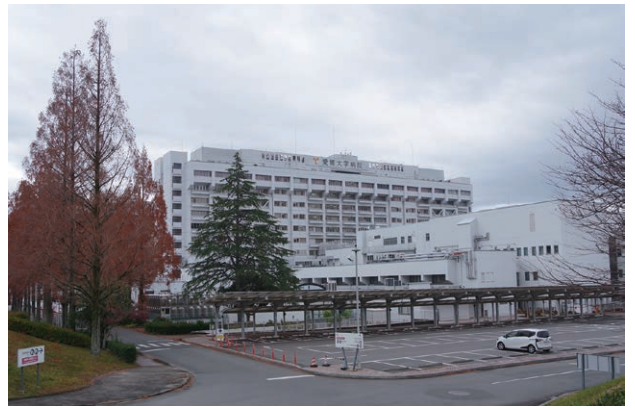
東温市の優れた医療環境の核となっている愛媛大学医学部附属病院