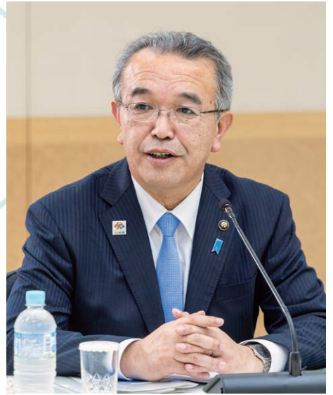
城戸 陽二 妙高市長(新潟県)