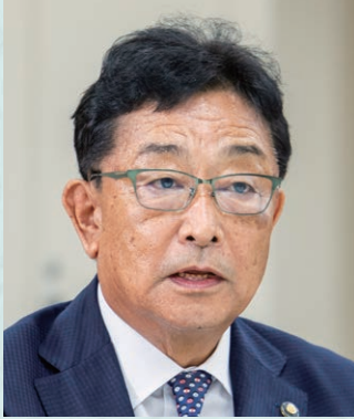
あらきけいじ 荒木恵司 きりゆう 桐生市長(群馬県)