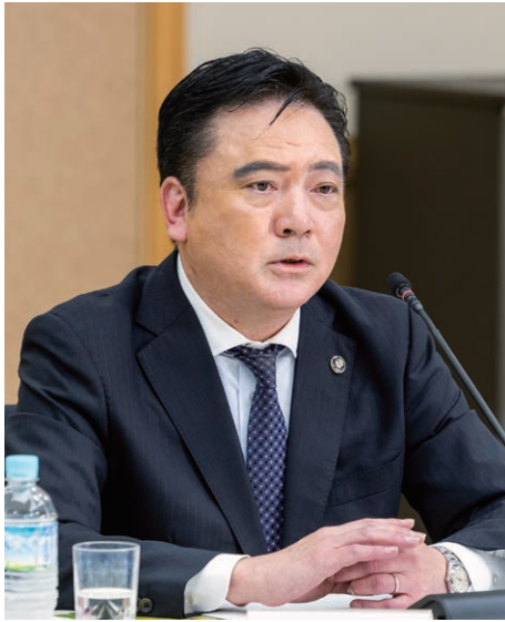
堀江 隆臣 上天草市長(熊本県)

SDGsの取り組みを 持続的なものにするためにも、 今後は活動の収益化を 図っていくことも必要です。