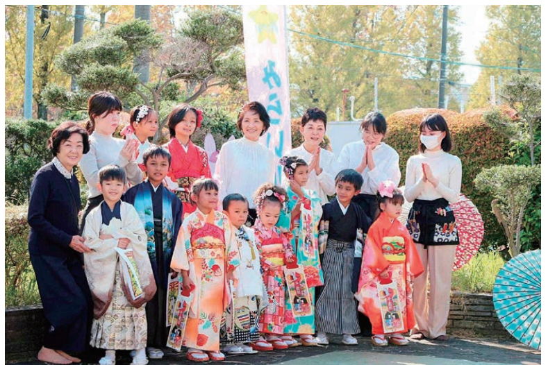
「七五三」では、外国人の子どもたちを対象に着物の着付け体験を実施(知立市)

の協力を得ながら、地域の環境負荷の軽減を図る施策も進めています。その一例として、家庭で発生した生ごみの堆肥化なども促しながら、可燃ごみの収集回数を、週3回から2回にあえて減らす取り組みも推進しました。反対の声が上がらなかつたわけではありませんが、環境にやさしい取り組みを市民と協働して着実に進めることは非常に大切なことだと考えています。