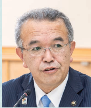
きどようじ 城戸陽二 みょうこう 妙高市長(新潟県)