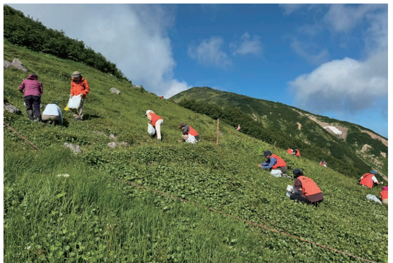
登録制のボランティア団体「環境サポーターズ」による自然環境保全活動(妙高市)

代表的な取り組みの一つが、近海に自生する海草の一種、アマモを活用したブルーカーボン事業です。アマモは多くの魚が産卵し、稚魚が育つ場所として、海の生態系に重要な役割を果たしていることに加え、二酸化炭素の吸収源としても注目されています。そこで、海洋環境の再生を図るとともに、カーボンニュートラルの一環として、民間企業や釣り人など