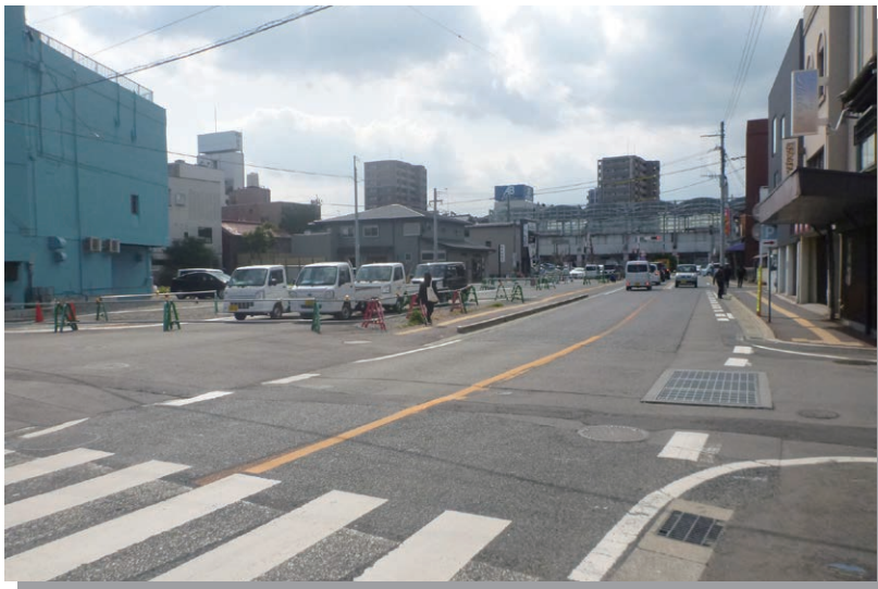
道路拡幅が進む 行橋駅前通り