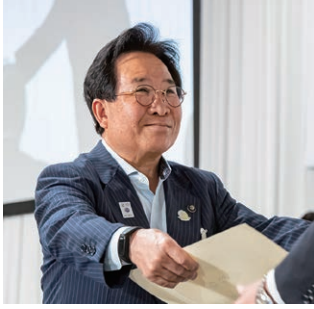
永年勤続功労表彰市長を代表して表彰を受ける山下・田原市長