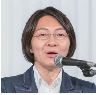
第1分科会委員長の伊東・倉敷市長