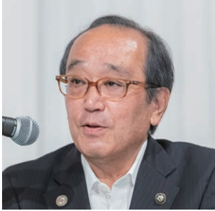
会長の松井・広島市長