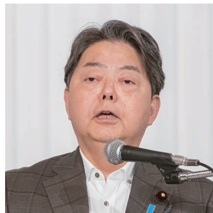
林・総務大臣祝辞