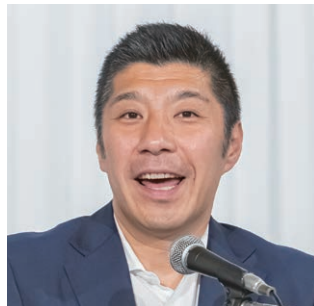
副会長：森・四日市市長