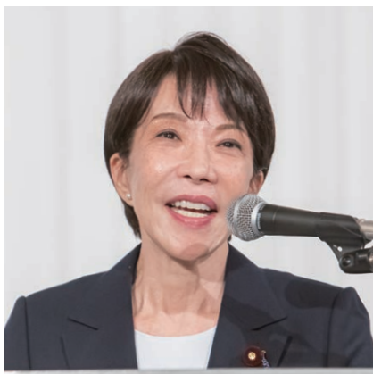
高市・内閣総理大臣祝辞