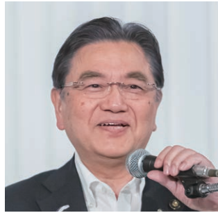
副会長：西行・福井市長