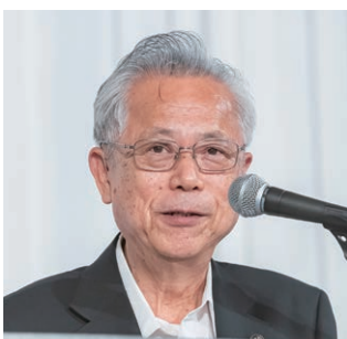
被表彰市長を代表してあいさつする神出・海南市長