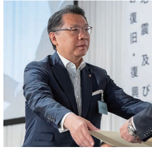
特別功労表彰を受ける成澤・文京区長