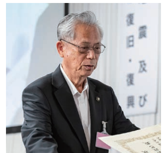
永年勤続特別功労表彰を受ける神出・海南市長