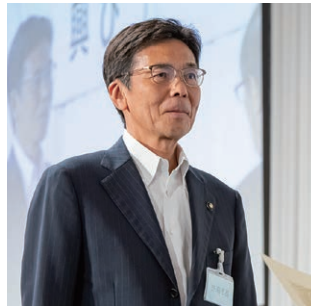
特別功労表彰を受ける齊藤・熱海市長