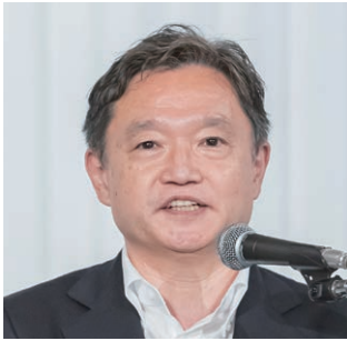
副会長：内館・盛岡市長