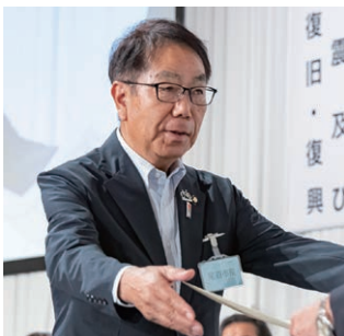
特別功労表彰を受ける平谷・尾道市長