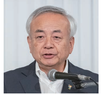
第4分科会委員長の菅原・気仙沼市長