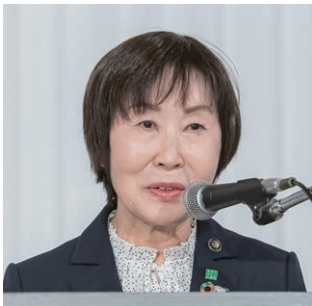
副会長：染谷・島田市