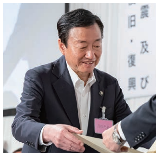
特別功労表彰を受ける大西・高松市長