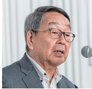
正副会長候補者選考委員会座長の原田・恵庭市長