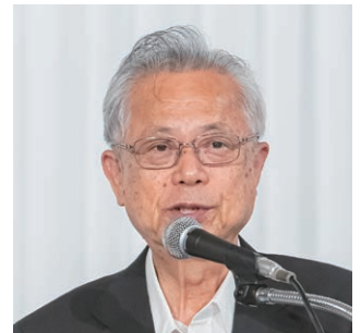
副会長：神出・海南市長