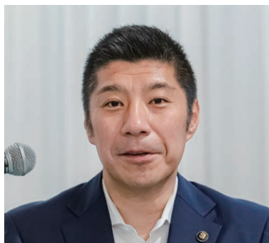
総会運営委員長として会議の進行に当たった 森・四日市市長