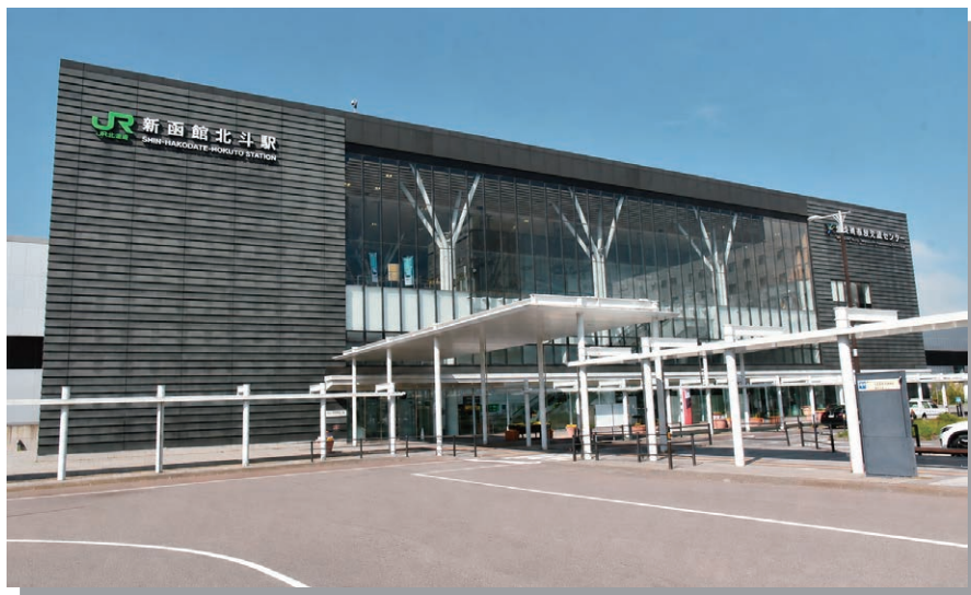
開業10周年を迎えた 「新函館北斗駅」